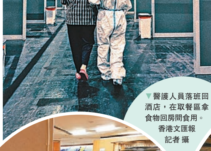
◆醫護人員落班回酒店，在取餐區拿食物回房間食用。