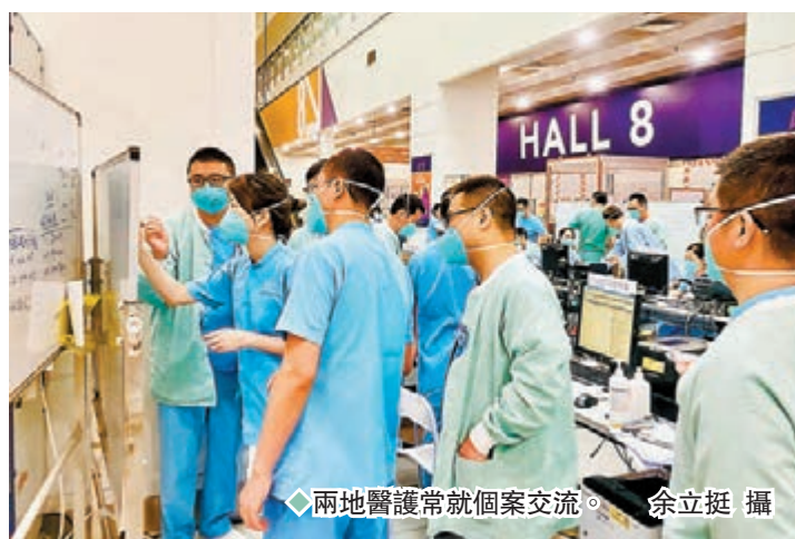
◆兩地醫護常就個案交流。