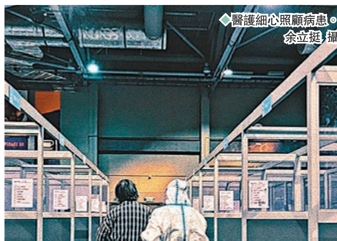
◆醫護細心照顧病患。