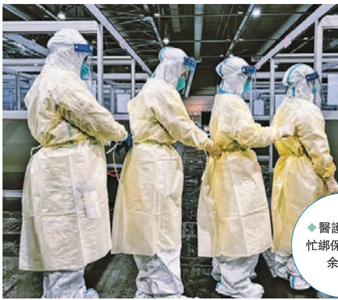
◆醫護互相幫忙綁保護衣。余立挺 攝