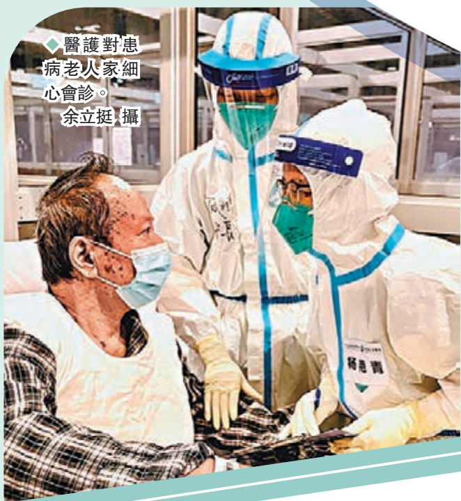
◆醫護對患病老以家細心會診。

專業經驗，第二天在診療的時候，就學以致用，評估病患的吞食情況，判斷是否要上胃管。」