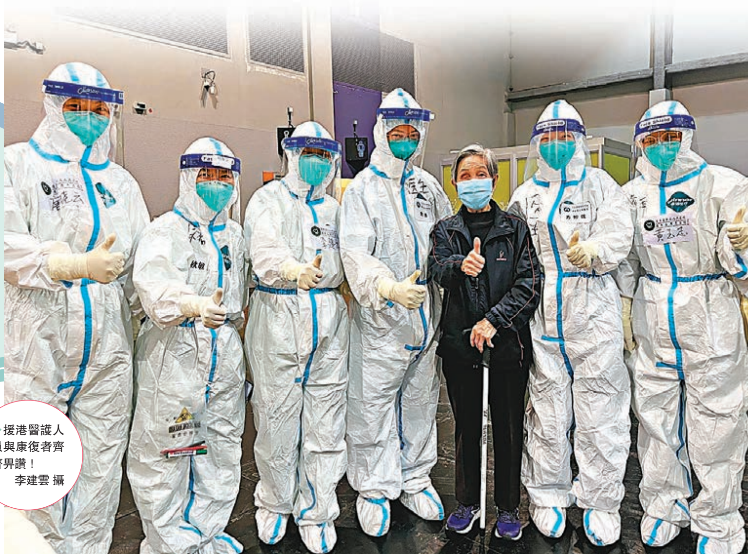
◆援港醫護人員與康復者齊齊揮手！