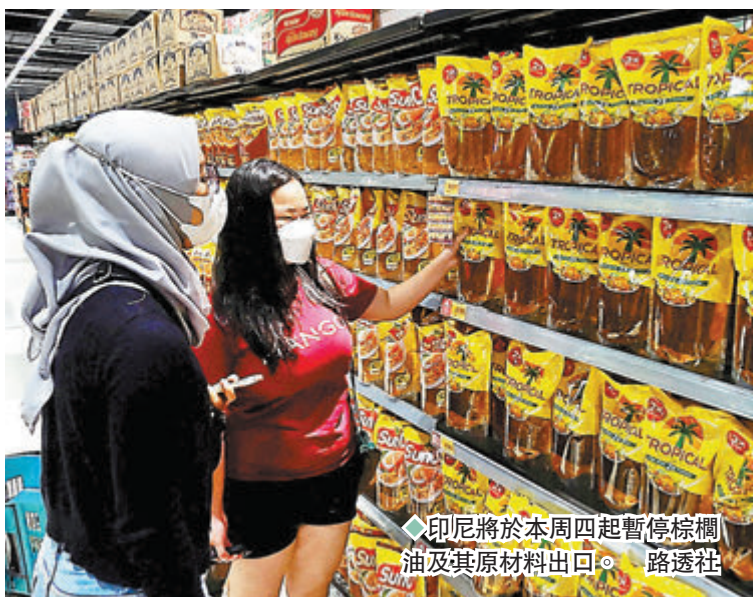
◆印尼將於本週四起暫停棕櫚油及其原材料出口。

俄烏衝突導致全球糧食緊張，烏克蘭盛產的葵花籽油產量大減，導致全球食用油供應減少和價格急升，作為全球最大棕櫚油生產國的印尼，上周五就以國內短缺為由，宣布將於本週四起暫停棕櫚油及其原材料出口，消息刺激昨日棕櫚油期貨價格一度大升7%。分析指，印尼禁止棕櫚油出口不但會進一步拉高其他食用油價格，亦會推高各種使用棕櫚油的加工或預先包裝食品的成本，勢必加劇全球食品通脹。