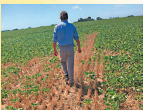
◆阿根廷因乾旱致大豆油出產減少。

事實上，早在俄烏衝突之前，全球植物油價格已經大升近半，原因是產量受到勞動力短缺以及乾旱影響而下跌。在南美，乾旱已導致大豆油最大出口國阿根廷的供應減少；在加拿大，乾旱亦導致油菜籽作物受災嚴重。