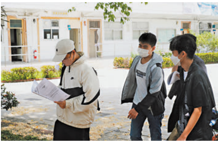
◆香港中學文憑試數學科必修部分昨日舉行。圖為考生完成後離開試場。

黃錦輝感慨指，這兩屆考生特別艱難，「上了兩三年的 Zoom，臨考前才被通知能否如期開考，每天考試前還要做快測……」他坦言，學生或許只考一次公開試，種種變數讓師生都感到無助，前天晚上，學生還在微信上「問數」，雖然希望能夠再解答他們的疑難，但考試逼近，只好要求他們在 11 點前睡覺，希望他們有充足睡眠，在考場上發揮應有實力。