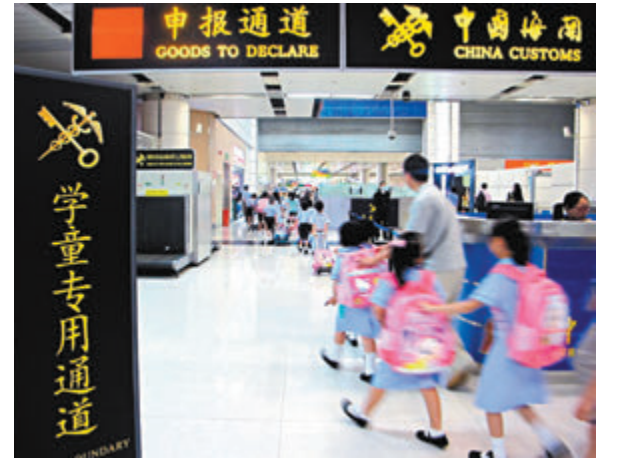
◆本學年就讀香港中小幼而居於內地的學生人數只剩下約 1.8 萬人，一年間大減近 9,000 人。圖為疫情前到香港上學的跨境學生。 資料圖片