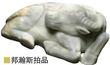
邦瀚斯拍品 乾隆青玉臥牛

倫敦邦瀚斯將於5月12日舉行「中國藝術精品暨書畫」拍賣，呈獻系列來自英國及歐洲大藏家之收藏精品，涵蓋玉器、宮廷瓷器、漆器、織繡、書畫等，琳琅滿目。