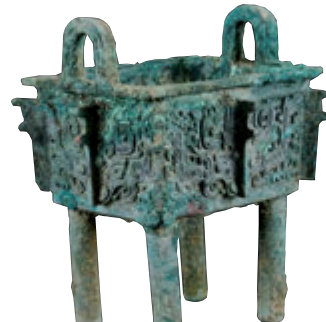
西周早期或更晚 青銅饗餐紋方鼎

保利香港2022年春季網拍，共推出高古藝術品、古典傢具、古董珍玩、書畫、時尚品、佳茗佳釀等九專場，帶來多元精彩的奇珍異寶。預展由近日至5月5日，地點：保利香港藝術空間（金鐘太古廣場1期7樓）。現將各場的基本情況介紹如下：