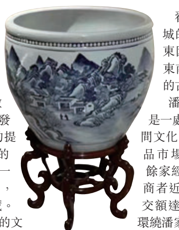
雍正 青花山水紋大卷缸

他表示：「永寶齋在港經營古董藝術品，並成功舉辦逾十屆的『國際古玩展』，有口皆碑，數十年來也建立起廣泛的人脈網絡。內地市場的熱鬧興起，本人及『永寶齋』早就通過不同的途徑參與其中，曾與名牌大學合辦古陶瓷學習課程，在電視台作嘉賓主持鑑賞活動，也曾聯袂京城的拍賣行推出『君一明十·九如陶瓷專場』，此陶瓷專場拍賣歷時兩年多來已成功舉辦五場，成交業績不俗。是次『永寶齋』獨立門戶，在已橫跨三個年度新冠疫情仍在肆的關健時刻，逆市進取，銳意擴充業務，就是對內地市場充滿信心。疫情總有過去的一