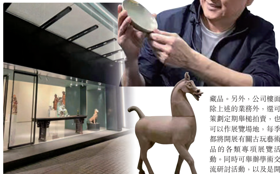
「永寶齋」寬敞開揚的門面