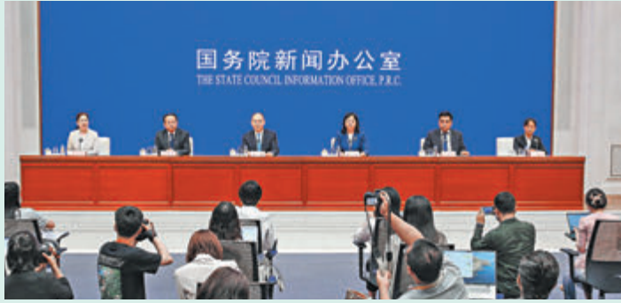
◆國新辦昨日舉行《關於推動個人養老金發展的意見》國務院政策例行吹風會。

國務院辦公廳近日正式印發《關於推動個人養老金發展的意見》提出，以自願原則，參與者每年最多繳納個人養老金的上限為1.2萬元(人民幣，下同)。人力資源和社會保障部副部長李忠昨日在國務院政策例行吹風會上表示，下一步將結合實際分步實施、逐步推開，選擇部分城市試行一年再總結推廣。 ◆香港文匯報記者 江鑫嫻 北京報道