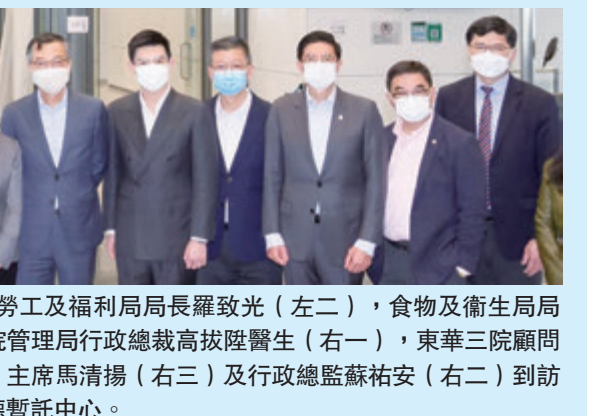
◆林鄭月娥(左三)與勞工及福利局局長羅致光(左二)，食物及衛生局局長陳肇始(左一)，醫院管理局行政總裁高拔陸醫生(右一)，東華三院顧問局成員譚鎮國(右五)、主席馬清揚(右三)及行政總監蘇祐安(右二)到訪東華三院協助營運的啟德暫託中心。

第五波新冠肺炎疫情為香港經濟與社會帶來沉重打擊。東華三院(下稱「該院」)一直心繫社會，繼早前撥出超過3000萬港幣防疫外，更緊急推出多項應對措施，援助有需要市民。 ◆林鄭月娥(左三)與勞工及福利局局長羅致光(左二)，食物及衛生局局長陳肇始(左一)，醫院管理局行政總裁高拔陸醫生(右一)，東華三院顧問局成員譚鎮國(右五)、主席馬清揚(右三)及行政總監蘇祐安(右二)到訪東華三院協助營運的啟德暫託中心。