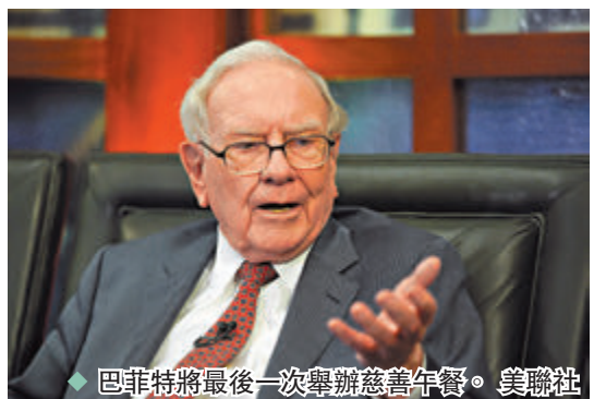
◆巴菲將最後一次舉辦慈善午餐。美聯社