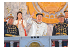
◆金正恩等朝鮮領導人出席閱兵儀式。