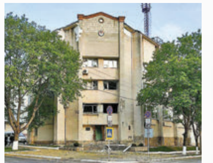
◆德涅斯特河沿岸地區有建築物受襲。

2014年提出加入俄羅斯。俄羅斯中央軍區一名副指揮官上周曾表示，俄國在烏特種軍事行動「第二階段」的目標，是全面控制頓巴斯地區以至整個烏克蘭南部，並打通往摩爾多瓦德涅斯特河沿岸地區通道，更指後者存在壓迫俄語民眾的個案。摩爾多瓦外交部其後召見俄羅斯大使，稱上述言論「毫無根據」。