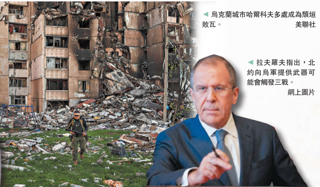
◀烏克蘭城市哈爾科夫多處成為殞垣敗瓦。