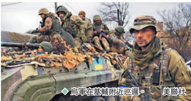
◆烏軍在基輔附近巡邏。

美國國務卿布林肯與防長奧斯汀日前訪問基輔，不但宣布繼續加碼對烏軍援，更揚言要削弱俄羅斯力量。俄羅斯外長拉夫羅夫日前據此警告稱，北約向烏軍提供武器，等同與俄方進行「代理人戰爭」，照此局勢發展，引爆第三次世界大戰以至核戰的風險都是真實存在，危險性不可低估。拉夫羅夫亦批評烏克蘭總統澤連斯基是假扮和談的「好演員」，實則根據美國和英國幕後建議，不斷阻撓真正的和談進程。