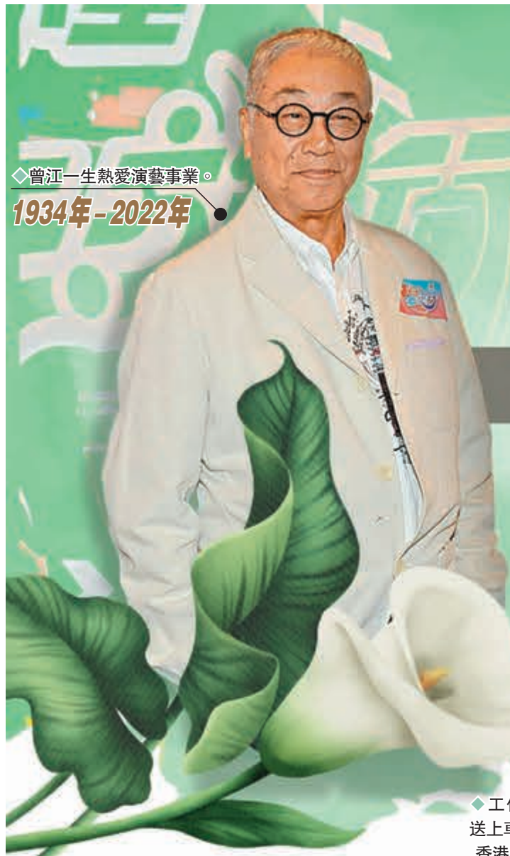
◆曾江一生熱愛演藝事業。 1934年-2022年

香港文匯報訊（記者 阿祖）昨日驚傳噩耗資深演員曾江倒斃於九龍一間檢疫酒店房間內，享年87歲。警員初步調查後將案件列作「屍體發現」，死因有待驗屍再作確定。曾江本月到星馬度假，輕鬆漫遊，順道探望老朋友。他縱橫演藝界逾60載，並永不言休，因他一直心繫香港電影業，覺得在這艱難時刻應盡一份力。沒料到他今次出遊星馬後，在酒店隔離期間突然離世，消息震驚娛樂圈。