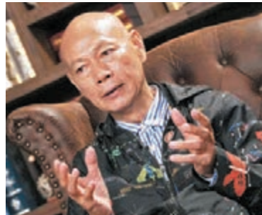
◆羅家英佩服曾江表演功力。