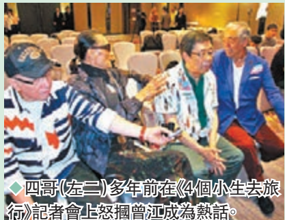
◆四哥（左二）多年前在《四個小生去旅行》記者會上怒捫曾江成為熱話。