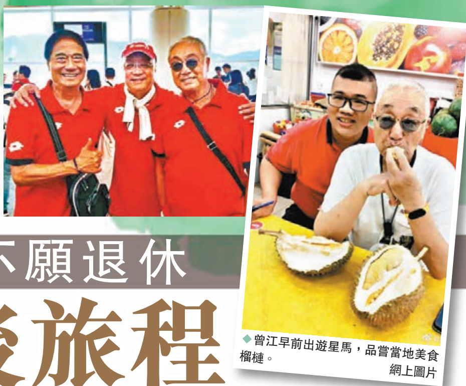
◆曾江早前出遊星馬，品嚐當地美食榴槤。