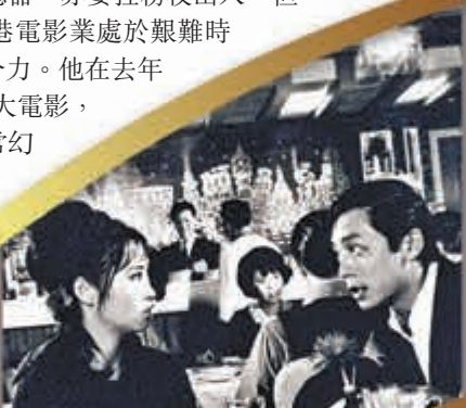
◆曾江在粵語長片曾與蕭芳芳合作。