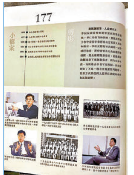
◆李家超曾以傑出校友身份接受訪問，圖為九龍華仁書院80周年紀念專刊。

家出來工作，知他升做總警司，才漸漸改叫「超哥。」雖然稱呼有變，但黎永良強調對方跟一班同學相處態度從來不變，為人隨和，毫無架子。