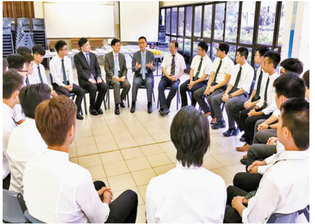
▶2017年，李家超及教育局局長楊潤雄一起返回母校九龍華仁書院，為該年應考中學文憑試的學弟打氣。資料圖片