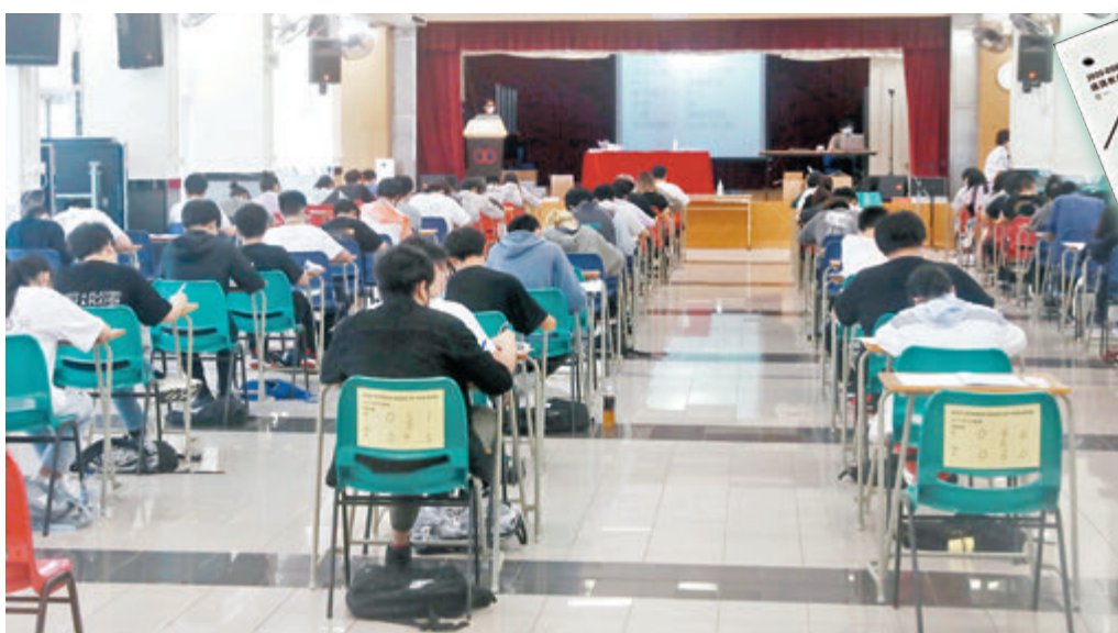
◆今年通識科考試題目包括東京奧運及遙距工作等「熱門」主題。圖為石硤尾廠商會中學試場。

中學文憑試通識科昨日舉行，約有4.4萬名考生應考。今年試題未有泛政治化的內容，三條必答題都以與學生生活密切相關的議題與事件切入，包括青少年參與義工、疫情下在家工作及東京奧運等，而選答長題目內容則包括網上祭祀、香港故宮文化博物館等。有中學通識科教師評論指，今年試題難度與去年相若，其中義工、網上祭祀等題目更是「恒常議題」；惟考生需要留神「暗比」類題目，即題目出現「最」、「優先」等字眼，答題時需要透過不同例子進行比較。