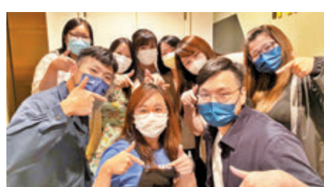
◆都大商學院「事業啟航計劃」，讓學生汲取工作經驗。

是次計劃由2月開始接受學生申請，為求在職位配對上更有成效，所有參與計劃的學生均須進行面試及甄選。首輪面試由商學院教師進行，教師會根據學生興趣、能力，以及參與機構的工作要求，為學生