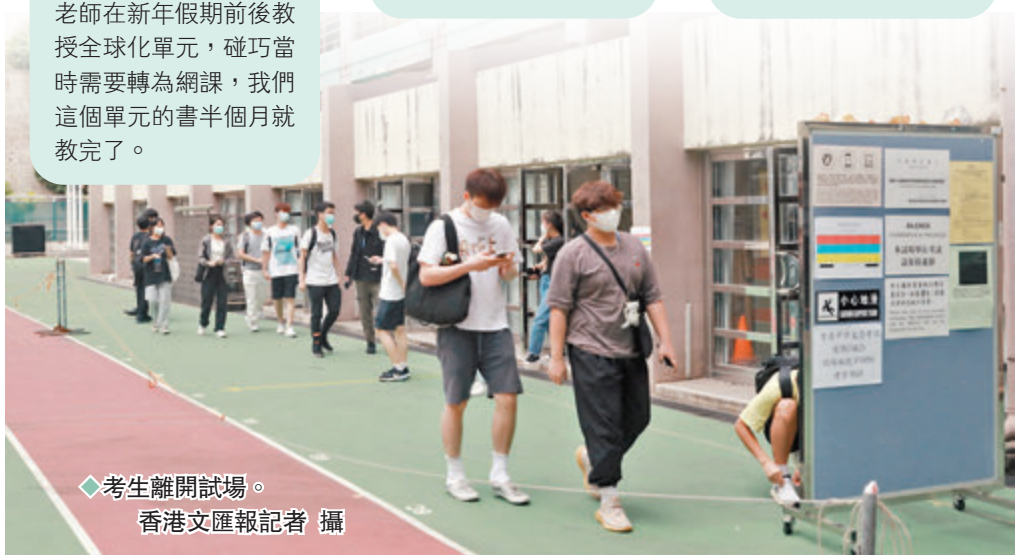
◆考生離開試場。

今年卷一有點難，卷二考得還可以。部分題目有一些難點，例如題目中出現「最」等字眼，則需要找出不同例子進行比較。