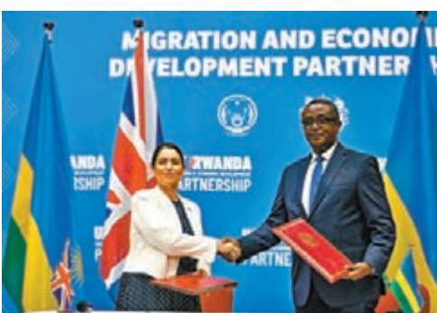
◆英國與盧旺達於本月較早前達成轉送安置協議。

內政大臣彭黛玲簽署的協議，指出彭黛玲在諮詢內閣後不久便簽訂協議，在未經國會辯論及投票程序下，內政大臣沒有權限簽署一項國際協議。該協議亦不符合《日內瓦公約》，兩人在英國申請庇護，理應留在英國等待申請結果。英國威爾斯事務大臣夏世民此前曾表示，盧旺達政府負責照顧接收難民，此舉可切斷販賣人口集團的收入來源。英國內政部昨日回應稱，表示早已料到政策會受到法律挑戰。 ◆綜合報道