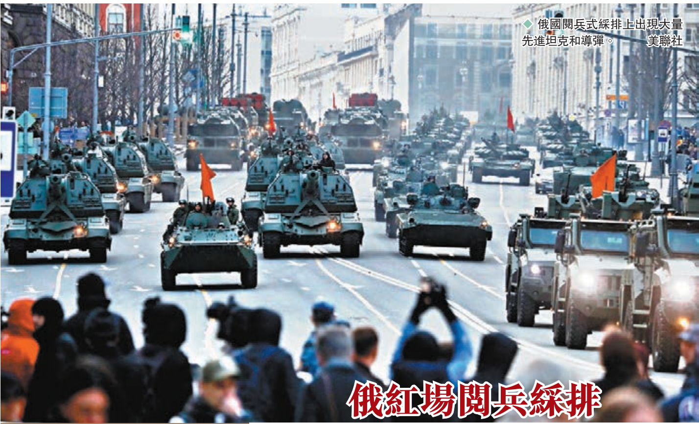
◆俄國閱兵式綵排上出現大量先進坦克和導彈。

澤連斯基在會後舉行的聯合記者會上，感謝古特雷斯對烏俄衝突的立場以及為緩和局勢進行的斡旋努力。他指馬里烏波爾亞速鋼鐵廠仍遭受轟炸，烏方願意就馬里烏波爾人員撤離問題與俄方進行「緊急會談」，希望古特雷斯的參與對人員撤離問題發揮有效作用。古特雷斯表示，聯合國在推動全面停火的同時，將繼續力求採取現實措施挽救生命、減少痛苦，包括維持有效的人道主義走廊、實現局部停火、為平民和物資補給提供安全通道。他訪問俄羅斯期間，俄總統普京原則同意聯合國和紅十字會參與亞速鋼鐵廠平民撤離，相關方正就落實這提議進行密集磋商，他對於安理會未有盡力避免和結束這場衝突「感到挫折和憤怒」。雙方還討論了聯合國增加對烏人道主義援助、聯合國參與烏戰後重建和解除俄對烏港口封鎖等問題。 ◆綜合報道