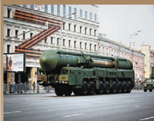
◆閱兵路線中的劇院被掛上大型Z字符號。

和BMP-3步兵戰車、「庫爾干人-25」步兵戰車、S-400防空導彈系統、道爾M2防空系統、「天王星-9」戰鬥機器人、MSTA-S型152毫米自行火炮、「旋風-G」型多管火箭炮系統等現代裝備。俄羅斯還將於5月4日在莫斯科紅場再次舉行閱兵夜間綵排，5月7日舉行總綵排。俄聯邦武裝力量陸軍總司令薩柳科夫為閱兵總指揮。 ◆綜合報道