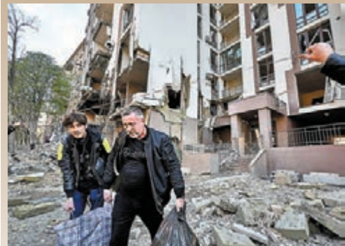
◆基輔一座建築物被炸毀，居民執拾細軟。