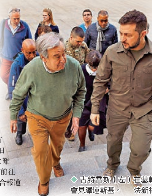
◆古特雷斯（左）在基輔會見澤連斯基。