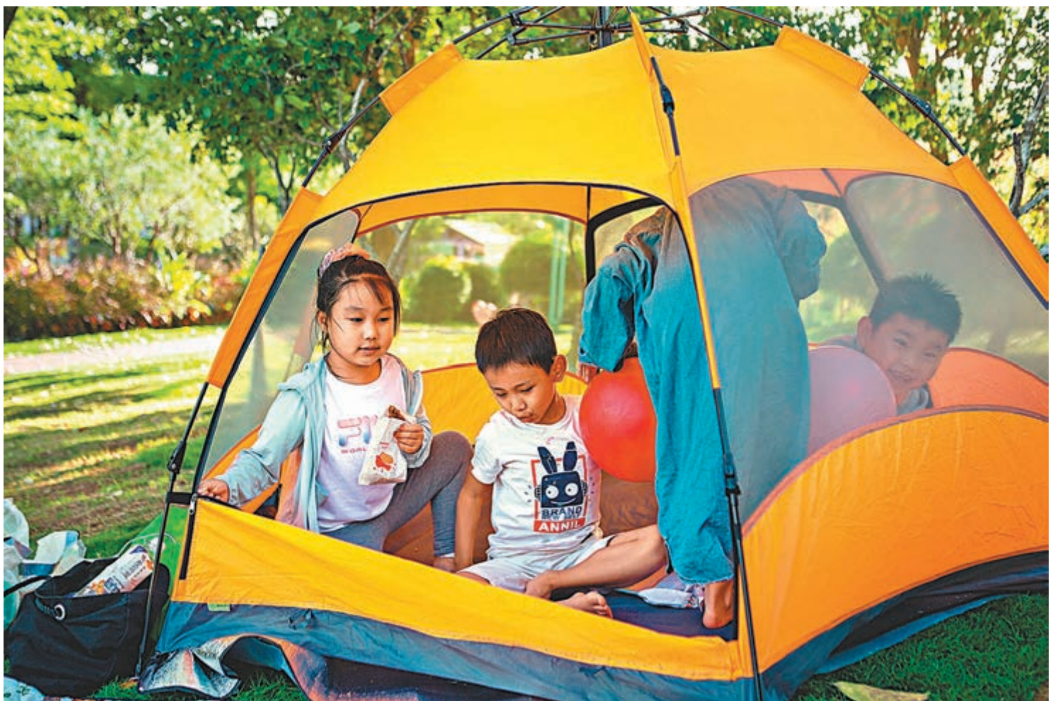
◆ 4月29日，深圳兒童樂園草坪上小朋友在帳篷內玩耍。

「鼓勵個人和有關組織積極舉報、控告拐賣婦女、兒童犯罪，規勸在逃犯罪嫌疑人投案自首。」通告顯示，對舉報人、控告人及其他有關證人，司法機關將依法予以保護。對威脅、報復舉報人、控告人，構成犯罪的，則要依法追究刑事責任。