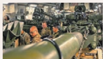
◆4月21日，美軍人員將M777牽引式榴彈炮送上運輸機。

目前西方國家對烏克蘭的軍援已經組織化，甚至長期化，而且軍援數量、質量上都有明顯提升。西方國家已經向烏方提供了50億美元的軍事裝備，其中30多億美元是美國提供的。最初西方國家提供的只是一些輕型裝備，例如單兵反坦克導彈，或防禦性武器，例如防空導彈等，現在提供的則是包括坦克、裝甲車、榴彈炮等在內的重型武器或進攻性武器，還包括軍用無人機、無線電設備、反坦克導彈等。最初只肯提供頭盔給烏克蘭的德國，現在都揚言要將防空坦克和榴彈炮