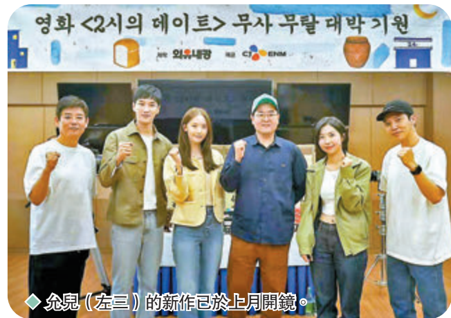
◆允兒(左三)的新作已於上月開鏡。

香港文匯報訊(記者 文芬)韓國女團少女時代成員允兒(YoonA)轉型做演員後,取得亮眼的成績,作品一部接一部。她和導演李相槿合作的新片《2點的約會》已於4月28日開機,現場照片亦曝光。該片由林允兒、安普