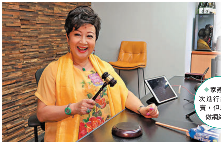
◆家燕姐首次進行網上拍賣,但就無意做網紅。