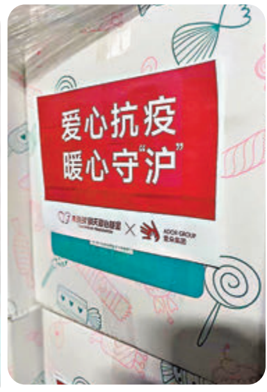
◆黃曉明援助兒童物品已經送往上海。