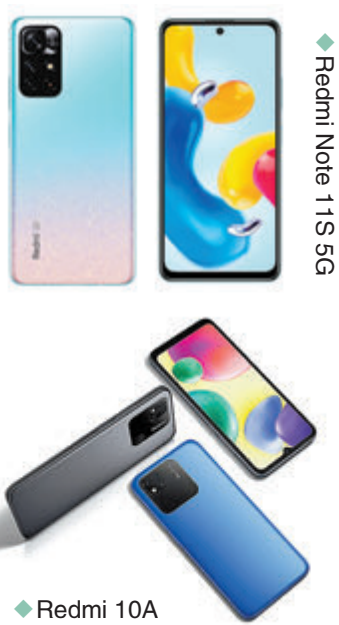
◆Redmi Note 11S 5G