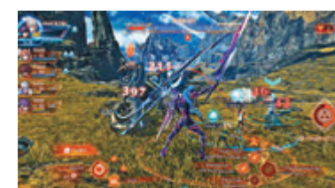
◆《異度神劍3》難得提早與機迷見面。

PS方面，圖跟Xbox Game Pass競爭的全新PS Plus服務計劃早前已披露若干資料，最近香港宣布將提早在本月23日搶先投入服務，較日本和北美還早。講開PS Plus，5月份的會員免費遊戲分別為知名足球遊戲《FIFA 22》、動作生存遊戲《Tribes of Midgard》和氣氛詭異的迷宮冒險遊戲《Curse of the Dead Gods》，明天將會上架。PS5其中一個起初已發表機能「可變更新率」