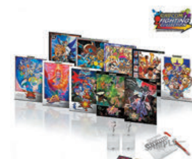
◆《Capcom Fighting Collection》代理商引入精品限定版。