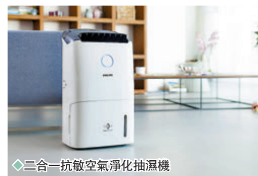
◆二合一抗敏空氣淨化抽濕機

它設有品牌經典4色全自動LED空氣質素顯示燈，讓用家時刻了解室內空氣質素，再按需要設定5段風速：1、2、3、4或特強風速，另備自動模式，根據空氣狀況即時自動調節風速，還獲得一級能源標籤，一機多功能，是納米級或大小單位都必備的納米級「乾」「淨」神器。