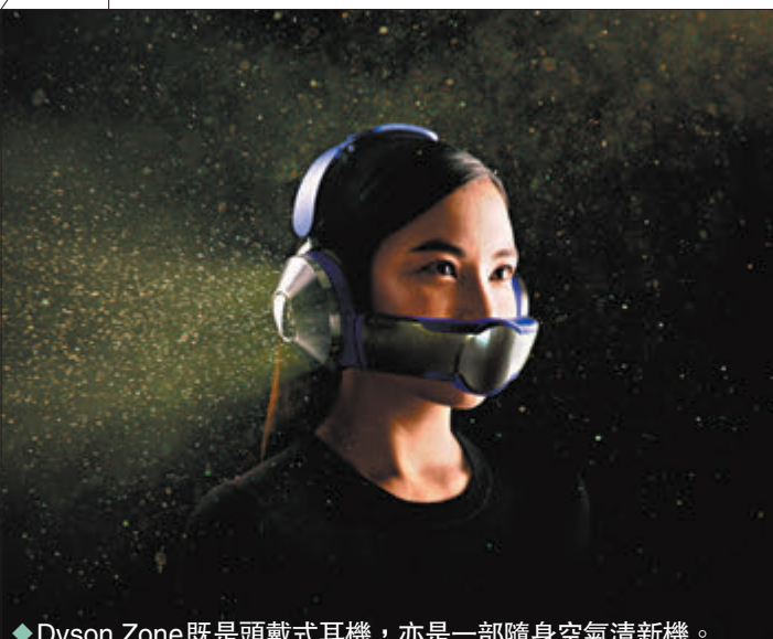
◆Dyson Zone既是頭戴式耳機，亦是一部隨身空氣清新機。