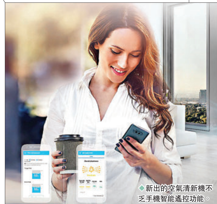
◆新出的空氣清新機不乏手機智能遙控功能。