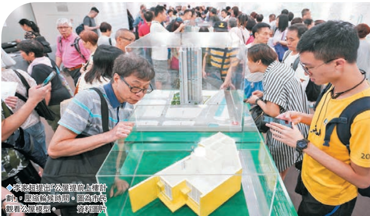
◆ 李家超提出「公屋提前上樓計劃」，壓縮輪候時間。圖為市民觀看公屋模型。