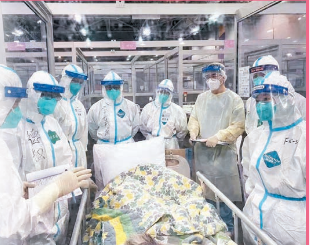
◆內地援港醫療隊隊員難忘與香港醫護站在抗疫一線，共同診治病患。