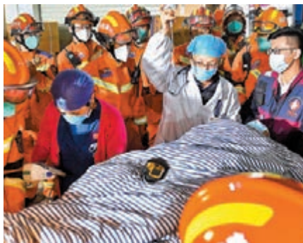
◆5月3日4時15分許，湖南長沙居民自建房倒塌事故近88小時後救出第9名被困者。新華社

院，除一名傷員因全身多處嚴重擠壓傷和臟器損傷暫未脫離危險期外，其餘傷者總體病情暫時平穩。衛健部門已成立心理諮詢專家團隊，及時做好傷員及家屬群體心理干預和支持。