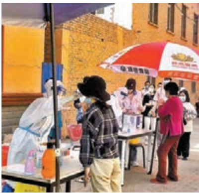
◆5月3日至5日，北京12區再次連續開展三輪區域核酸篩查。

北京嚴格進返京管理，明確四類人員嚴控出京：近期北京市中高風險地區人員；有1例及以上感染者的街鄉鎮人員；封控區、管控區及臨時管控區人員；「北京健康寶」彈窗人員，