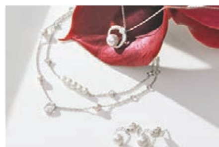
◆18K白色黃金美鑽珍珠首飾