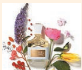
◆Creed Millesime Aventus For Her

Sephora亦精選一系列人氣熱賣的香水, 有些香水形狀更是一只高跟鞋, 頗為特別。