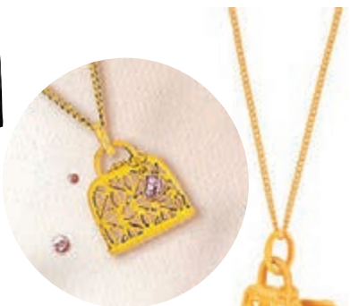
◆小提包吊墜可打開