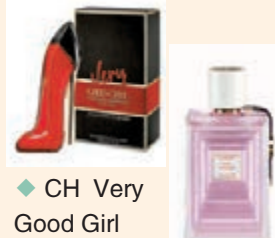
◆CH Very Good Girl