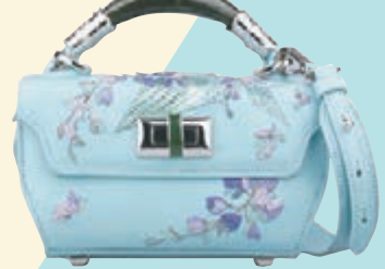
◆經典刺繡玉鐲手把提包