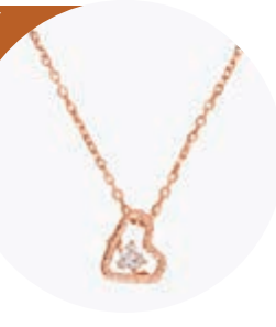
◆傳統典雅心形系列

今個母親節, agnès b.精選Bijoux系列優雅之選, 月亮石擁有溫暖人心的療癒能量, 更能突顯個人魅力, 適合送給氣質溫柔婉約的媽媽。月亮石系列推出項鍊、品牌字樣手鍊, 更備有橢圓造型耳環及吊墜式耳環兩款, 用以出席不同場合配搭多種風格。而傳統典雅的心形系列, 以純銀鍍18k玫瑰金打造心形外框包裹閃亮鑽石, 傳遞對媽媽的感恩之心。