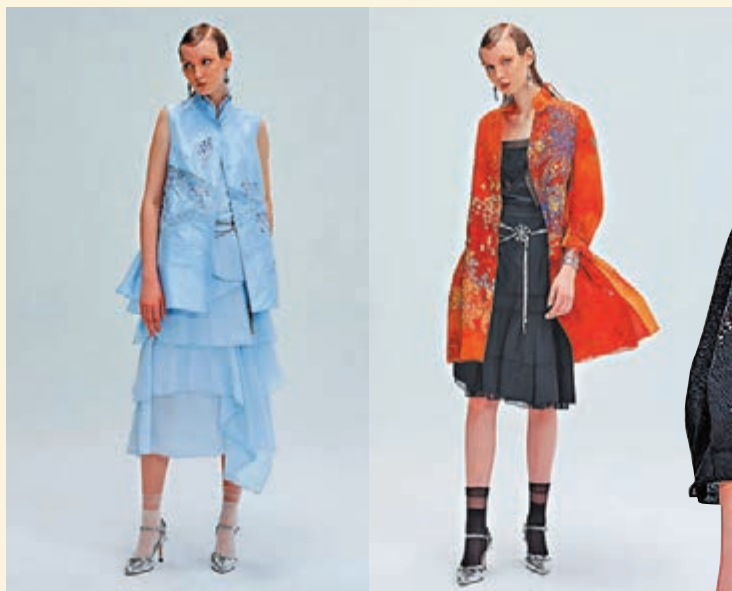
◆塔夫綉手工刺繡背心配多層次純絲雪紡洋裝 ◆開版印花純絲烏干紗連袖長上衣