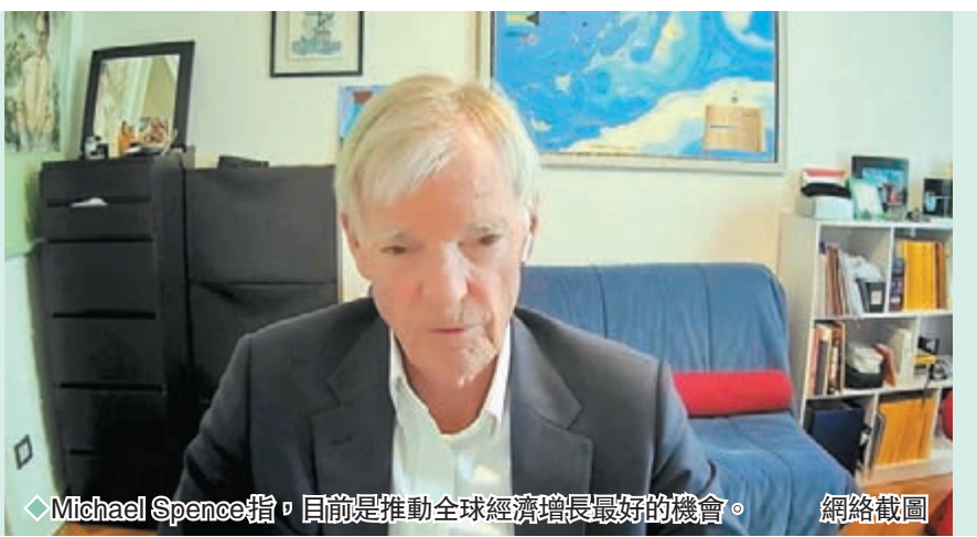
Michael Spence 指，目前是推動全球經濟增長最好的機會。

Michael Spence 表示，大家生活在一個日益老齡化的全球經濟中，而且中國比過往具有較少的低生產力勞動力，加上全球加強去碳化，推動更廣泛地使用潔淨能源，以及新冠肺炎疫情與俄烏衝突影響全球的供應鏈，令全球多個地區面臨多年來未見的通脹壓力，至於央行推行緊縮貨幣政策則會打擊經濟增長。因此他認為全球經濟增長將取決於生產力的發展。他表示目前推動全球經濟增長最好的機會，能加強全球經濟向數字化方面轉型，推動生產力急速上升。