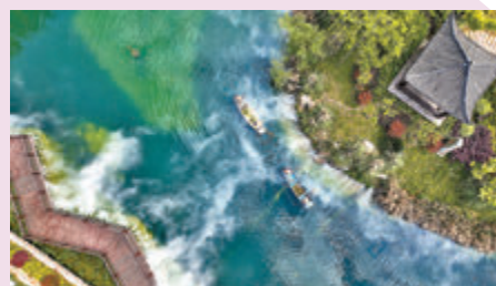
◆河道保潔員在進行日常保潔。

近年來，浙江省湖州市德清縣洛舍鎮，居民積極守護碧水美家園，落實水生態修復工程，通過清淤疏浚、清理網兜、設置生態護欄、種植水生植物等生態治水模式，有效改善水環境整體效果，鄉村人居環境大大提升。例如，在洛舍鎮東衡村的美景下，河道保潔員不時在進行日常保潔，讓鄉村自然風光得以發亮。