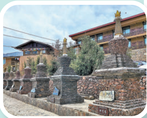
◆當地對扎尕那景區提升改造