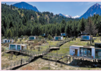
◆中查溝森林中搭建的装配式酒店