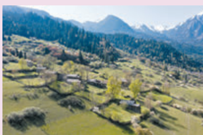
◆中查溝是一個典型的高半山藏族村寨