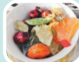
◆當地的扎尕那神泉八寶茶