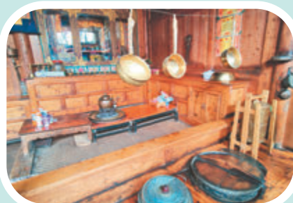
◆存在百年的老實藏式民居