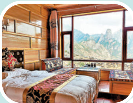
◆優美的自然環境讓當地民宿得到快速發展