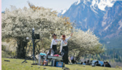
◆中查溝居民在草甸上直播