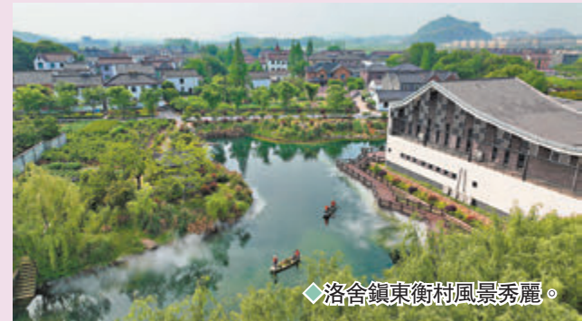
◆洛舍鎮東衡村風景秀麗。