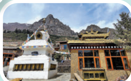
◆濃濃的藏鄉風情讓遊客流連忘返