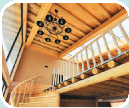
◆當地打造的星空民宿今年可接待遊客