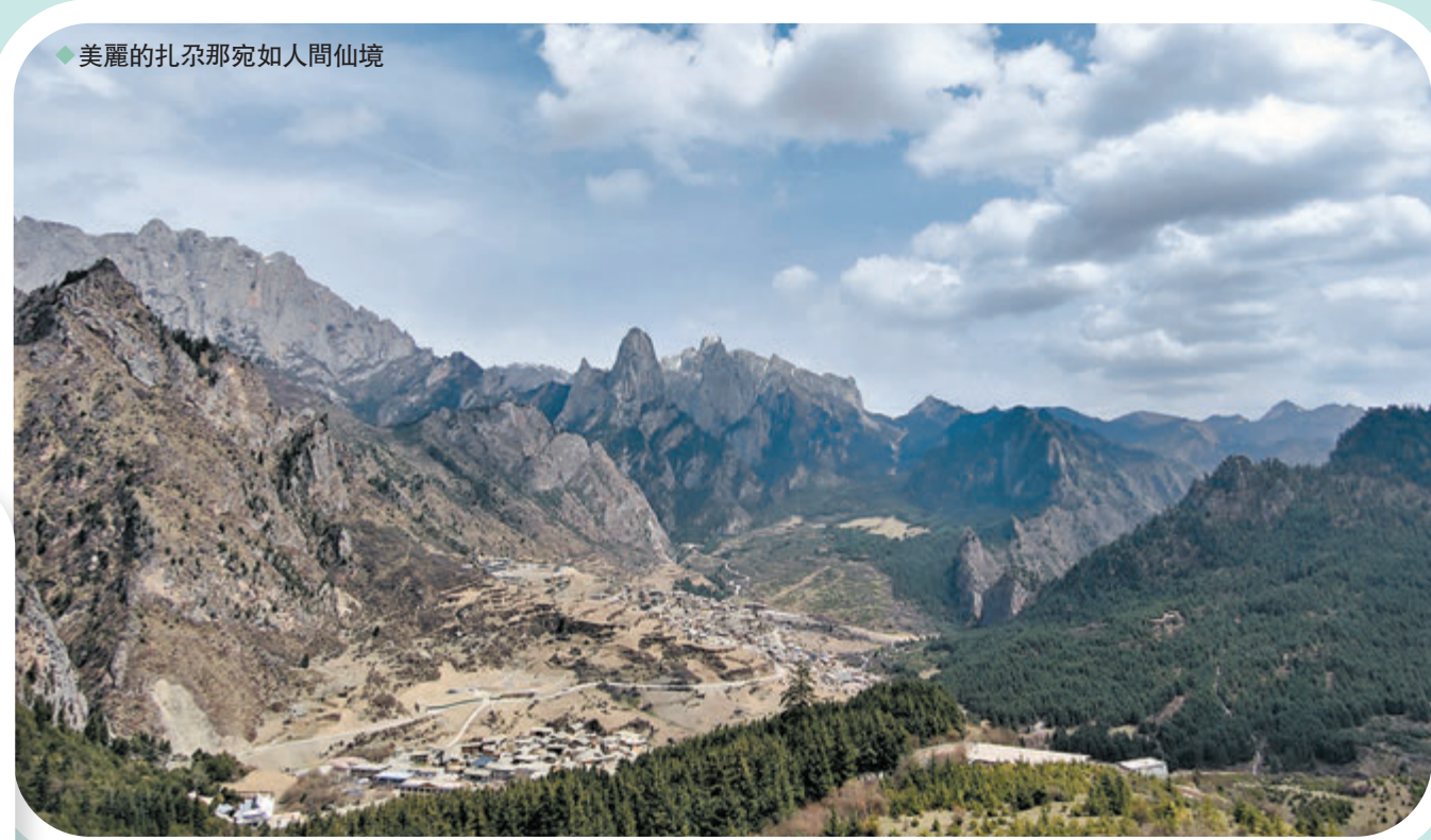
◆美麗的扎尕那宛如人間仙境