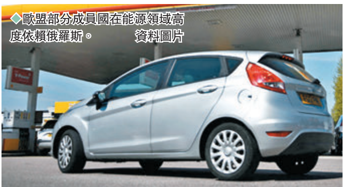
◆歐盟部分成員國在能源領域高度依賴俄羅斯。