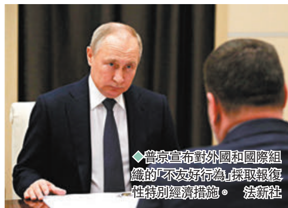
◆普京宣佈對外國和國際組織的「不友好行為」採取報復性特別經濟措施。

俄羅斯總統普京前日簽署總統令，對某些外國和國際組織的「不友好行為」採取報復性特別經濟措施，包括禁止各級國家機構、組織和個人與被俄方制裁的不友好國家和組織的法人、個人和企業進行交易，包括簽訂外貿合同；禁止對被俄方制裁對象履行交易義務和金融交易；禁止向被俄方制裁對象出口俄產品和原料。總統令要求聯邦政府在10日內確定被制裁國家和組織以及個人名單。