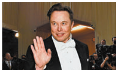
◆馬斯克日前出席活動時神采飛揚。