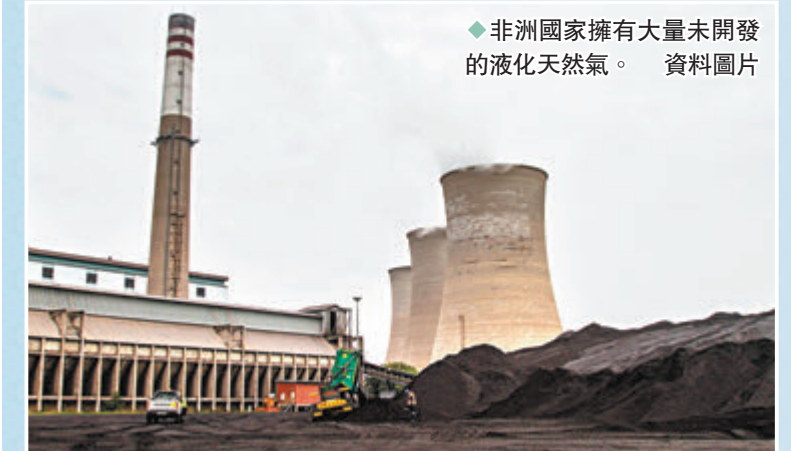
◆非洲國家擁有大量未開發的液化天然氣。 資料圖片