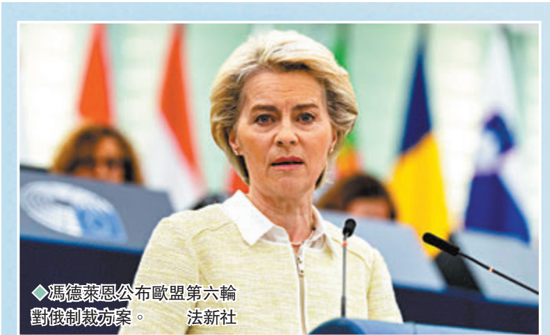
◆馮德萊恩公布歐盟第六輪對俄制裁方案。