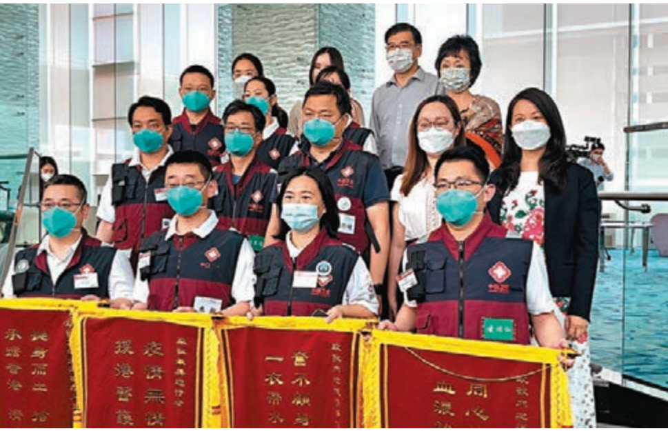
◆市民代表向內地援港醫療隊致送6面錦旗及18區市民感謝留言紀念冊。

市民留言致謝 ◆非常感謝國家派來的醫護工作者對香港的無私奉獻和犧牲精神！向你們致敬！ ◆辛苦你們了！你們讓香港人感到背脊祖國歲月靜好！謝謝你們！願你們平安！ ◆感謝你們冒着生命危險來支援香港，香港人民感激您的付出和辛勞！深深感受到你們的勇敢。 ◆衷心感謝最美逆行者，抗疫之路感謝有你們付出的大愛。祝願你們平安、健康！