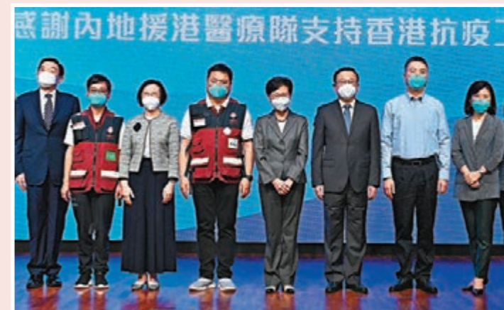
◆香港特區政府為內地援港醫療隊舉行歡送儀式，特首林鄭月娥、中聯辦副主任何靖等出席。

何靖昨日在內地援港醫療隊感謝及歡送儀式上致辭。他讚揚醫療隊在港兩個月期間日以繼夜投入抗疫，展現了極高的專業水平及敬業精神，目前香港疫情明顯好轉，離不開他們的貢獻。