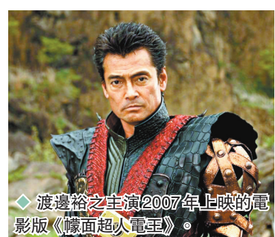
◆渡邊裕之主演2007年上映的電影版《幪面超人電王》。

渡邊裕之外形健美，在1980年拍廣告入行，並因拍攝經典能量飲品廣告而讓人認識。他又以51歲之齡成為年紀最大的韓國超人，掀起話題。至於其遺作則是今秋在日本上映的電影《貞子DX》。