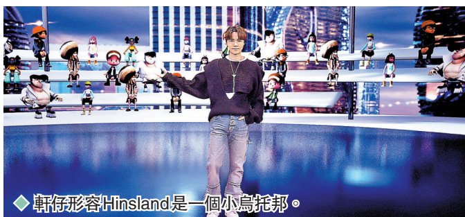
◆軒仔形容Hinsland是一個小烏托邦。

英皇娛樂是香港首家於The Sandbox布局構建虛擬音樂娛樂體驗空間的娛樂公司，發布會以線上形式舉行，首次融合XR（延展實境）技術，虛擬與現實世界結合。「Hinsland」搭建了多個場景，包括HC大宅、Fans Club、「櫻花樹下」，甚至軒仔的「遮遮」都會出現，將虛擬與現實世界結合在一起。