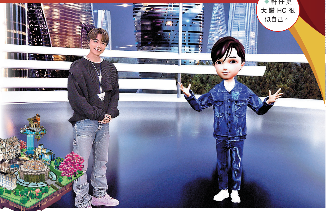
◆軒仔更大讚HC很似自己。