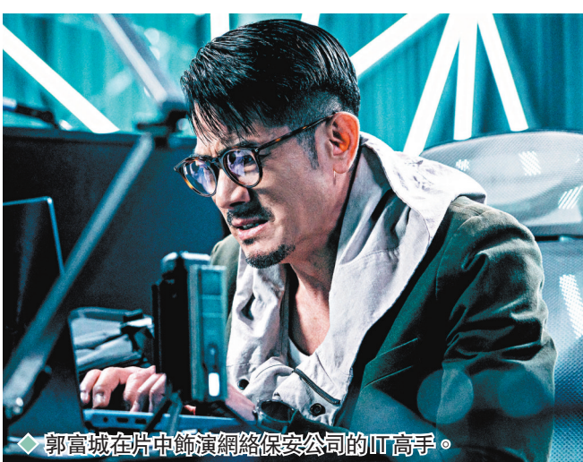
◆郭富城在片場中飾演網絡保安公司的IT高手。

在《斷網》電影海報及宣傳短片中，郭富城所飾演網絡保安公司的IT高手，神色凝重地按着鍵盤，並異動地透過電腦屏幕穿梭現實與網絡世界。除了戲中有三大影帝門法外，另一大賣點便是電影公司花費將近二千萬元打造出戲中的網絡森林，將虛擬和實景交疊得很精緻。城城表示：「戲中的網絡世界我們稱之為網絡森林，之前因為疫情，不便於街上取景，於是團隊變陣，在香港找到非常漂亮的樹林景進行拍攝，因為現場高樹林立，形態各異，再加上一些美術陳設，透過鏡頭，有一些窗口，不用加CG（電腦特效）已經好靚，拍出來也有一定效果及質感。但今次電影CG團隊為求創造新視野，以高效特技，去強化營造不同層面的網絡世界，務求令觀眾有嶄新的觀感感覺，看到不同場景各種虛幻又真實的交錯結合，非常切合全部電影題材。」