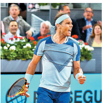
◆拿度慶祝勝利。

2022年馬德里網球公開賽當地時間4日繼續展開，之前錯過過阿密大師賽和蒙地卡羅大師賽等賽事的西班牙「天王」拿度傷癒復出，在男單首圈輪空下次圈贏分6:1、7:6(4)，淘汰塞爾維亞球手基斯文奴奴，晉級16強。女雙比賽，中國球員張帥與澳洲球手桑德斯的組合以6:4、6:3擊敗法國/澳洲組合，闖入4強。