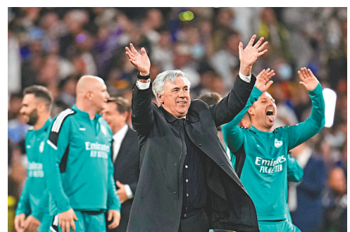
◆安察洛堤再創歷史。

上屆亞軍曼城今仗同樣錯過幾次入球機會，皇馬「門神」高圖爾斯上半場先後救出貝拿度施華及菲爾科頓的險球，基亞利殊入替後的兩腳射門又先後被護空門及貼柱而出，埋下出局伏筆。已有11年沒再嚐到登頂歐聯滋味的曼城教頭哥迪奧拿賽後頗為沮喪，「這種功虧一簣的感覺非常糟糕，除最後時刻外，我們今天踢得一直很精彩。不過足球是要看入球數，對手比我們多入1球。」