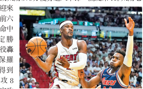
◆占美畢拿(左)是役為熱火貢獻22分12助攻6籃板。

太陽主場129:109大勝獨行俠。上半場兩隊打得難解難分，獨行俠球星當錫節節攻入14分，但領先一方卻是太陽，半場結束獨行俠曾逆轉領先60:58，迪雲布卡第3節連續命中三分球又助太陽以6分優勢進入末節。關鍵第4節太陽老將基斯保羅迎來爆發，本節前六次出手全部命中為球隊奠定勝局。布卡此役轟下30分，保羅16投11中得到28分及助攻8次；當錫則空砍35分和7助攻。