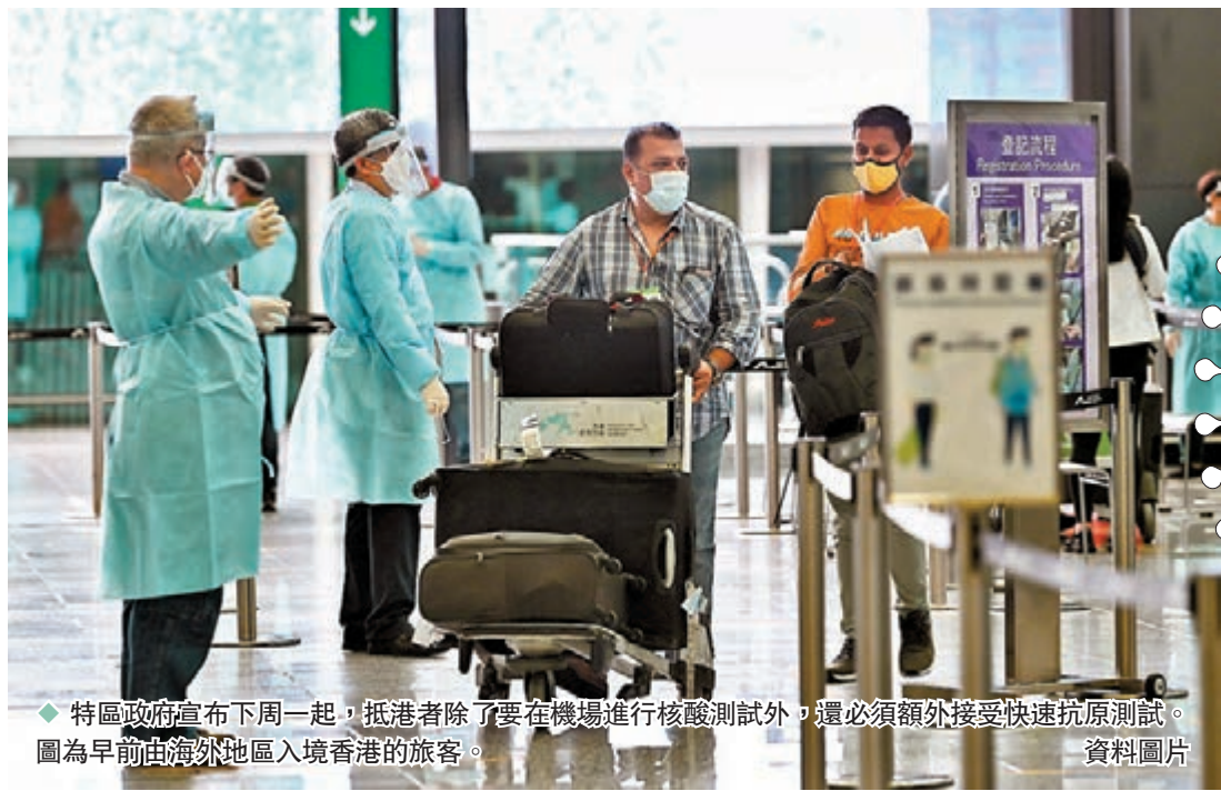
◆特區政府宣布下周一起，抵港者除了要在機場進行核酸測試外，還必須額外接受快速抗原測試。圖為早前由海外地區入境香港的旅客。資料圖片

香港昨日新增324宗新冠肺炎確診個案，其中29宗屬輸入病例，為特區政府取消9個國家「禁飛令」以來新高。特區政府昨日宣布，下周一（9日）開始，抵港者除了要在機場進行核酸測試外，還必須額外接受快速抗原測試，以加強外防輸入，及早發現及隔離抵港的感染者。衛生防護中心傳染病處首席醫生歐家榮在疫情記者會上指出，4月至今有18名入境人士完成酒店檢疫後，在抵港第12日於社區檢測呈陽性，除兩宗屬本地感染外，其餘相信是「復陽」個案，重申要求抵港者登機前檢測呈陰性及抵港後再接受檢測和入住檢疫酒店，是防止變種病毒流入香港的重要措施。