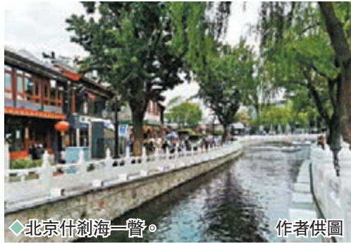
◆北京什刹海一瞥。

位於前海西街的恭王府，是清代最大貪官和坤的豪宅。眾所周知，大權在握的和坤心狠手辣，他不啻視國庫如私產，還將巨額軍餉裝入私囊。據說當年從其「藏寶樓」抄出金磚就有4,288塊，金銀財寶折合白銀高達9億兩（當時朝廷一年財政收入才7,000萬兩），按如今白銀開盤價，折合人民幣3,600億元！據悉恭王府裏藏有一萬多幅