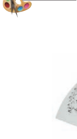
趙素仲作品 菩提路上 弘一大師的足跡