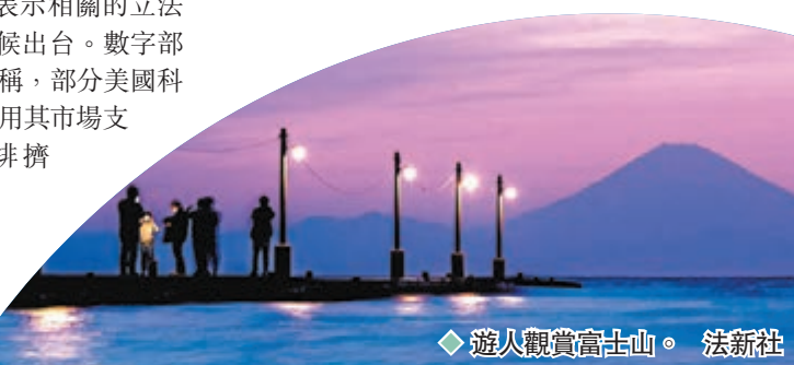
◆遊人觀賞富士山。