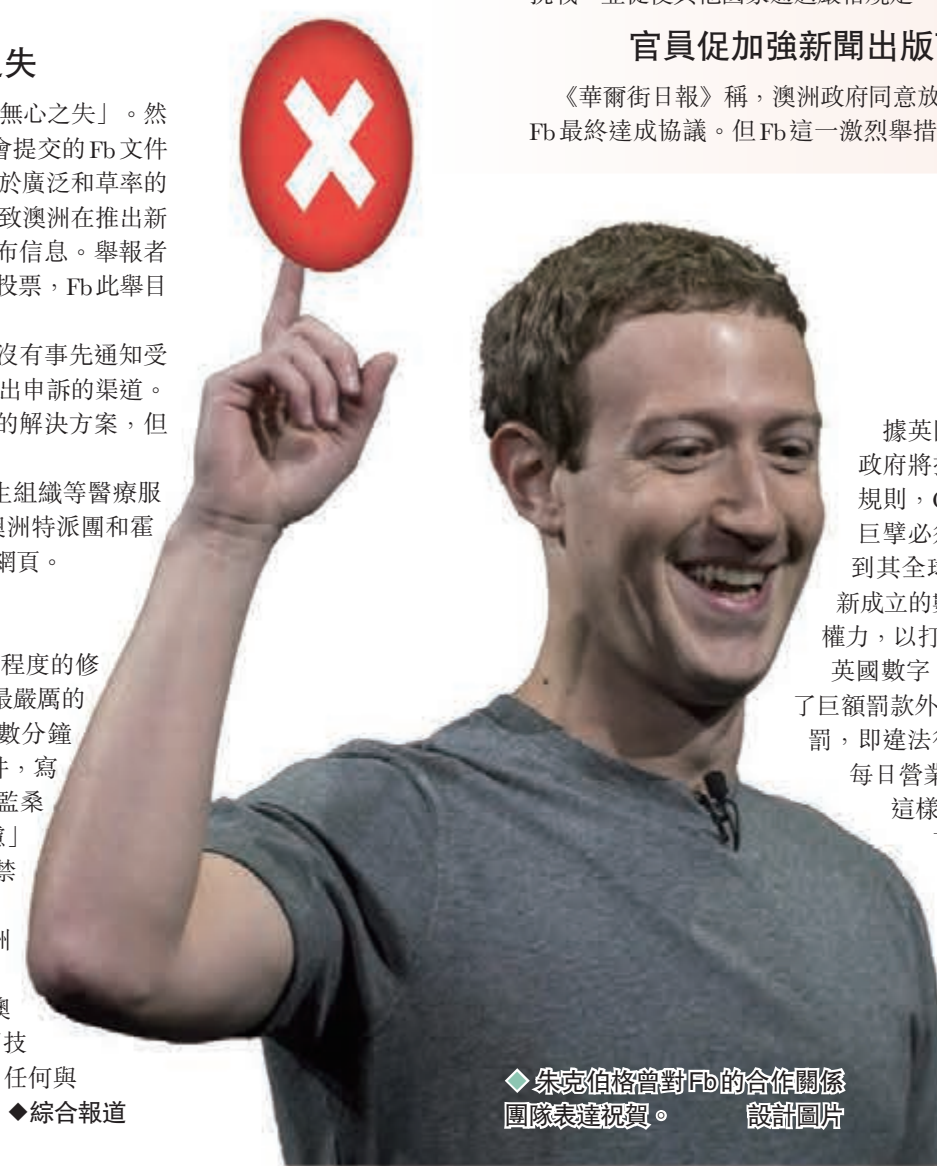
◆扎克伯格曾對Fb的合作關係團隊表達祝賀。