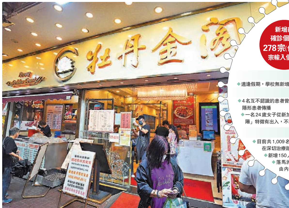
◆元朗「牡丹金閣尚品火鍋涮涮鍋」出現群組感染，4名食客近日相繼確診。