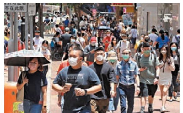
◆一名由新加坡來港的女子，於抵港第12天檢測時發現呈陽性。圖爲香港街頭人頭湧湧。

他又認爲香港入境防疫措施有條件進一步放寬，建議如果抵港人士已打齊三針，或接種兩針後感染