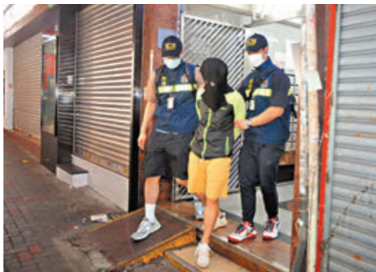
◆海關在行動中拘捕洗黑錢集團4名骨幹成員。

香港文匯報訊(記者 蕭景源)海關展開代號「鷹網」行動,偵破一個洗黑錢集團,共拘捕4名涉案男女。他們涉嫌於兩年間分別利用虛擬貨幣平台和傀儡