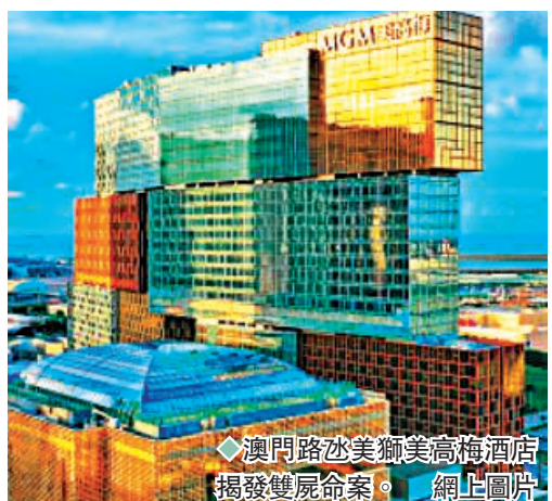
◆澳門路氹美獅美高梅酒店揭發雙屍命案。

香港文匯報訊(記者 蕭景源)澳門路氹美獅美高梅酒店昨日凌晨揭發雙屍命案。兩名女子被發現全身赤裸伏屍一房間內,頸項有明顯勒痕,證件及財物盡失。死者身份及死因有待進一步確定,澳門司警懷疑兩女被浴袍帶勒斃,正全力追緝涉案兇徒。