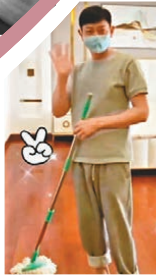
◆劉德華的住家男人Look另有一番魅力。

都會出席，這次因為懷孕生B，無法前往有點遺憾，昆凌轉發了韓國巨星G-Dragon的一段影片，片中他用中文開心地問候歌迷，似乎也打動了昆凌的心，讓她忍不住表示「想度假了」。