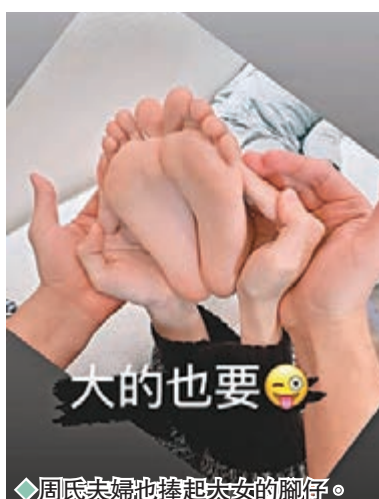
◆周氏夫婦也捧起大女兒的腳丫。