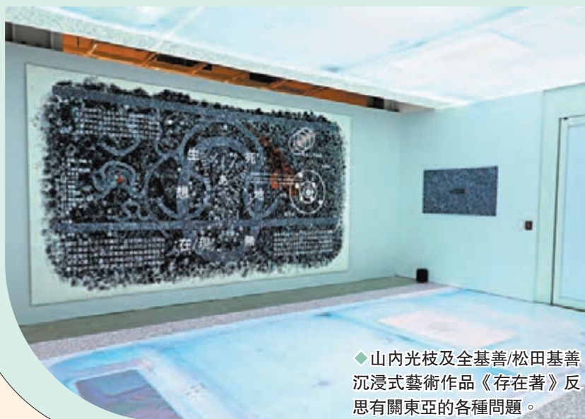
◆山内光枝及全基善/松田基善 沉浸式藝術作品《存在著》反 思有關東亞的各種問題。