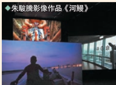
◆朱駿騰影像作品《河鰻》