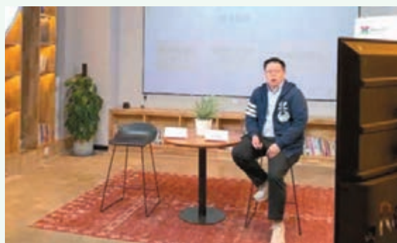
◆作者參與港澳青年子女在京教育專題線上講座。

當然，若再細細論及，這樣的講座能受歡迎，肯定是和越來越多港澳人士來北京發展的大背景息息相關。值得一提的是，最近內地疫情又起，全國多地都一派緊張態勢，又因時值五一放假，大家有假期卻沒法玩，實則都有一些意見。在這樣的關頭，很多在京的港澳人士自發站了出來，組成了各種各樣的志願者隊伍，協助工作人員（內地稱穿着防護服的醫護人員為「大白」）進行核酸檢測。我因為假期學校尚有工作任務，不能參與到這樣的隊伍中，但是看到各行各