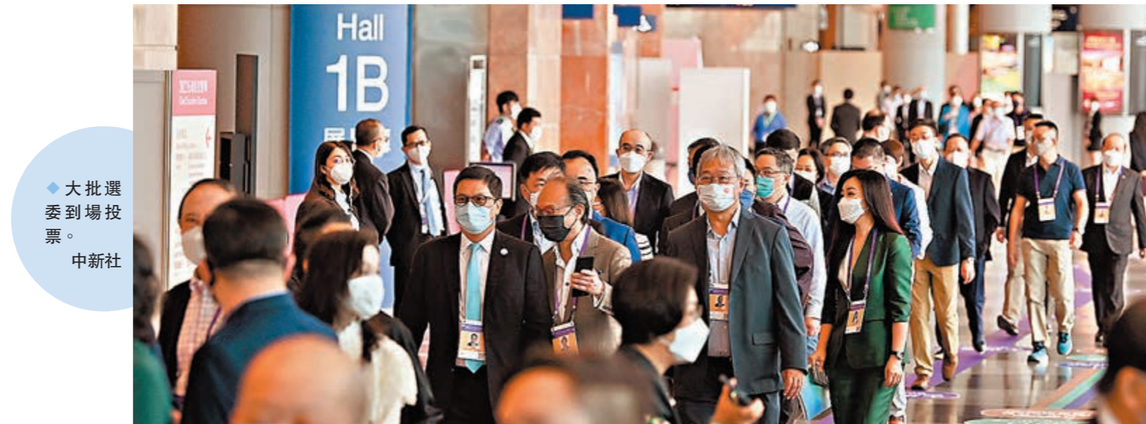
◆大批選委到場投票。