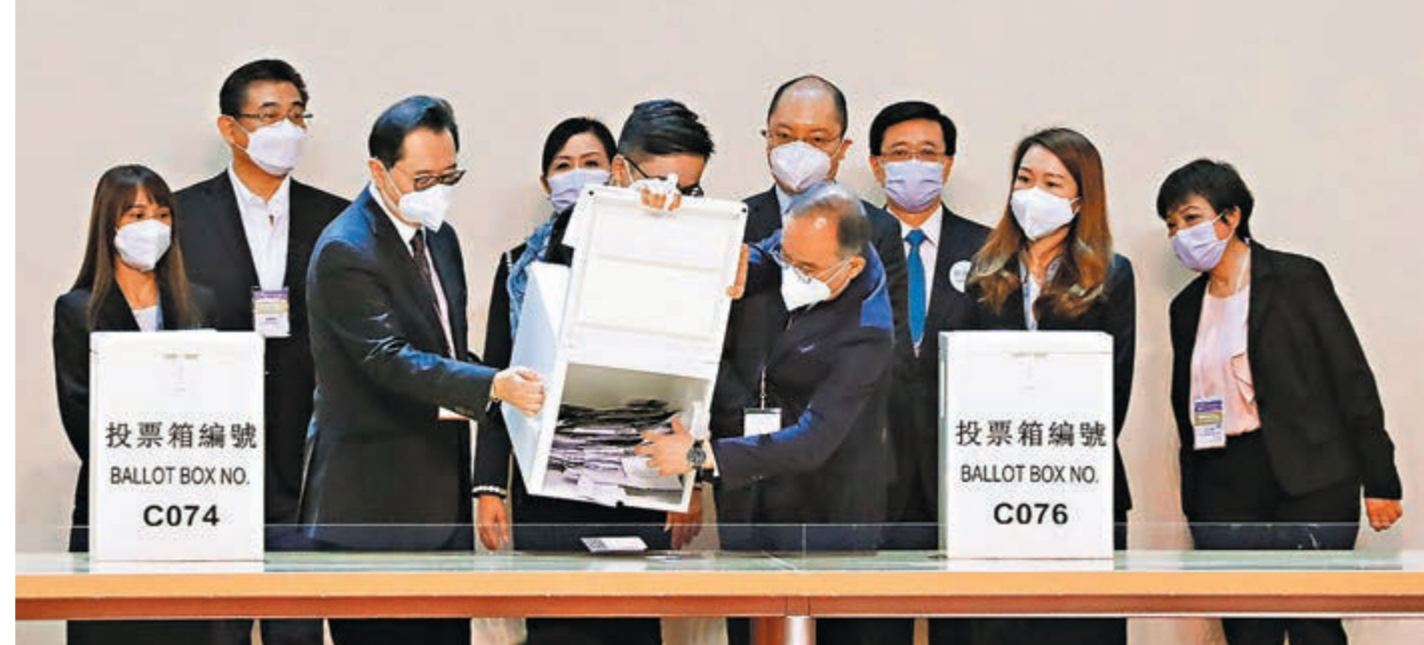
◆選舉結束後，選管會主席馮驊（前排左）和政制及內地事務局局長曾國衛（前排右）向選委中的選票，進入點票程序。

協同社會各界 實現更多目標 在談到他在競選時提倡的「以結果為目標」施政理念時，李家超表示，他會以變革思維建立更有承擔、更具團隊精神、更能夠解決問題的特區政府，會致力提升特區政府的執行效能和管治能力，實現更好的施政效率和成果，施政亦以解決市民的問題為首位。 加快房屋供應 優化醫療系統 他會以變革精神重點克服和解決社會最迫切、市民最關注的問題，包括要使土地房屋供應提速、提效和提量；用有力的措施優化醫療護理系統；多措並舉創造青年的上流機遇；加快實施規劃，建設關愛社會，讓廣大市民得益。 李家超說，發展也是解決許多問題的關鍵，新一屆特區政府會利用好「一國兩制」的制度優勢，全面融入國家發展大局，深度參與粵港澳大灣區建設，搭上經濟發展的快車；同時鞏固香港國際大都會的特質，發揮香港自由開放、聯通世界的優勢，營造更美好的投資環境，強化香港連接世界和內地最直接的橋樑作用，全面提升競爭力。 「長期以來，困擾香港的不同問題，許多都是沒有解決的方案，而是落實的成績未符合市民的預期。」李家超希望「以成果取信於民」。上任後，他會全力推進落實政綱的工作，同時會保持與不同人士、社會各界溝通聯繫，積極推廣其他方面的施政工作。新一屆政府會以行動爭取信心，以結果收斂分歧，以成績凝聚互信，齊心協力建設一個更宜居、更開放、更和諧，一個充滿希望、機遇、活力的香港。