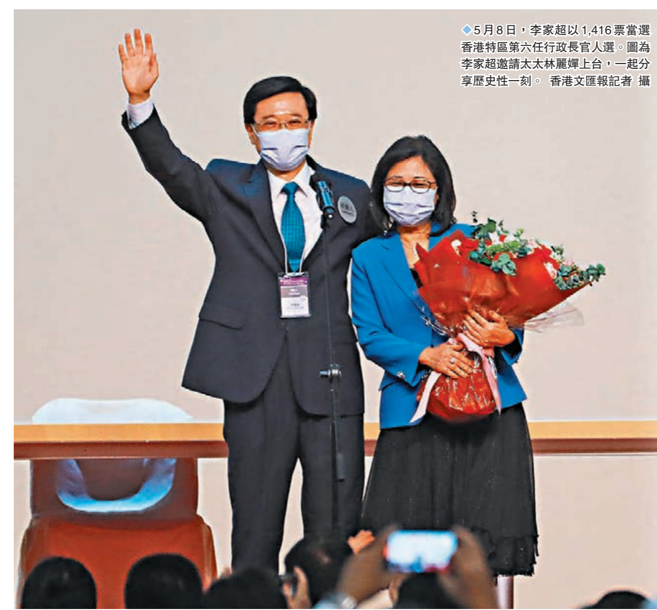
◆5月8日，李家超以1,416票當選香港特區第六任行政長官人選。圖為李家超邀請太太林麗輝上台，一起分享歷史性一刻。