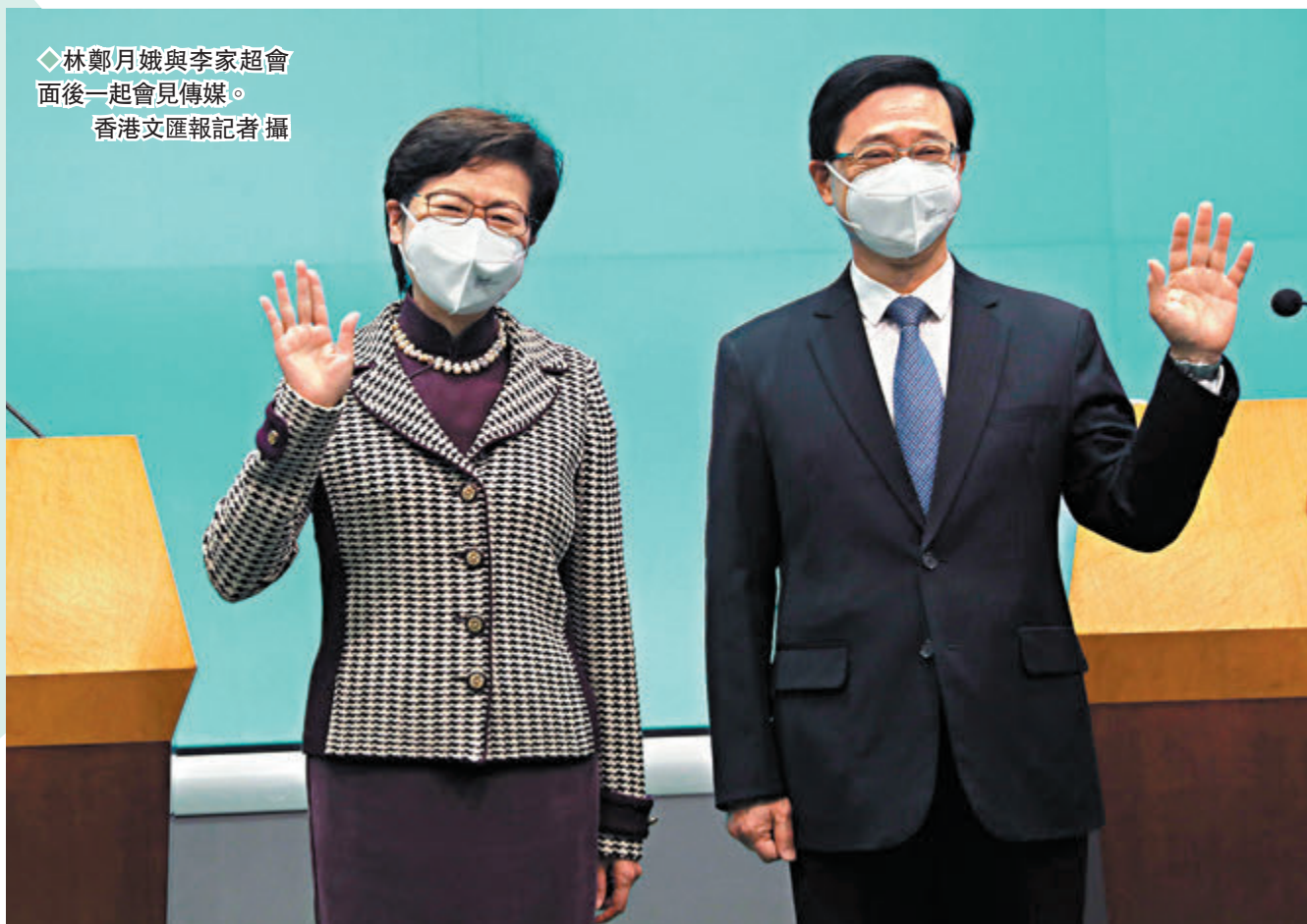
◆林鄭月娥與李家超會面後一起會見傳媒。