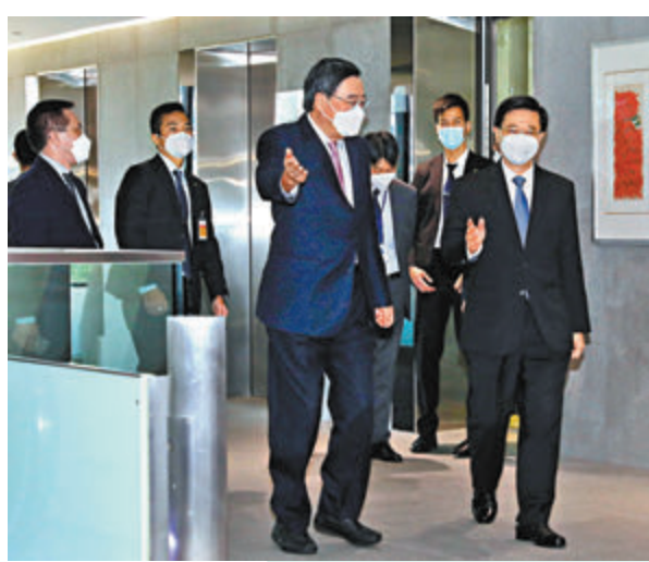
◆李家超昨日到訪立法會，梁君彥在大樓內迎接。

監察施政，同時會利用他們的地區經驗和專業知識，為新班子建言獻策，建立良性互動的行政立法關係。