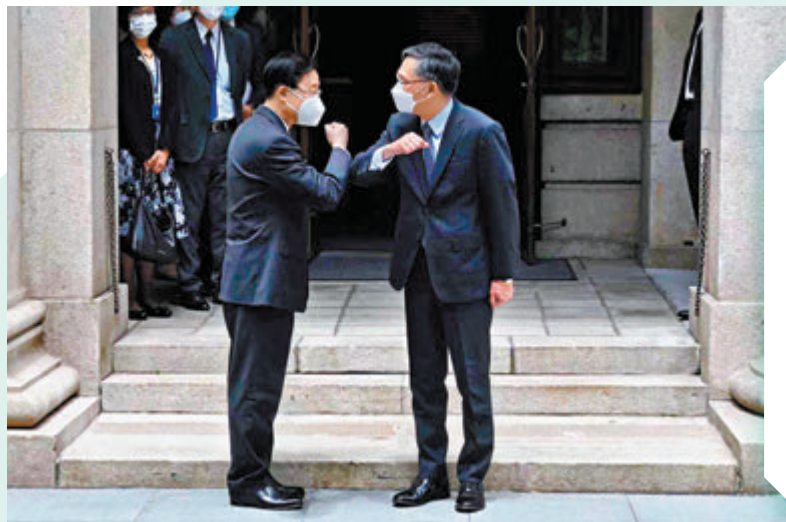
◆李家超拜會張舉能後互相碰臂道別。

香港文匯報訊（記者 藍松山）李家超在選舉期間強調了法治及司法獨立對香港來說十分重要。昨日，李家超前往特區終審法院與首席法官張舉能會面，逗留約半小時後離開。兩人在會面結束時互相碰臂道別。政府新聞處發稿指，李家超在會面中重申，會堅定維護法治及司法獨立，並會全面支持及配合司法機構所需資源，確保法院可以按照基本法履行職責。