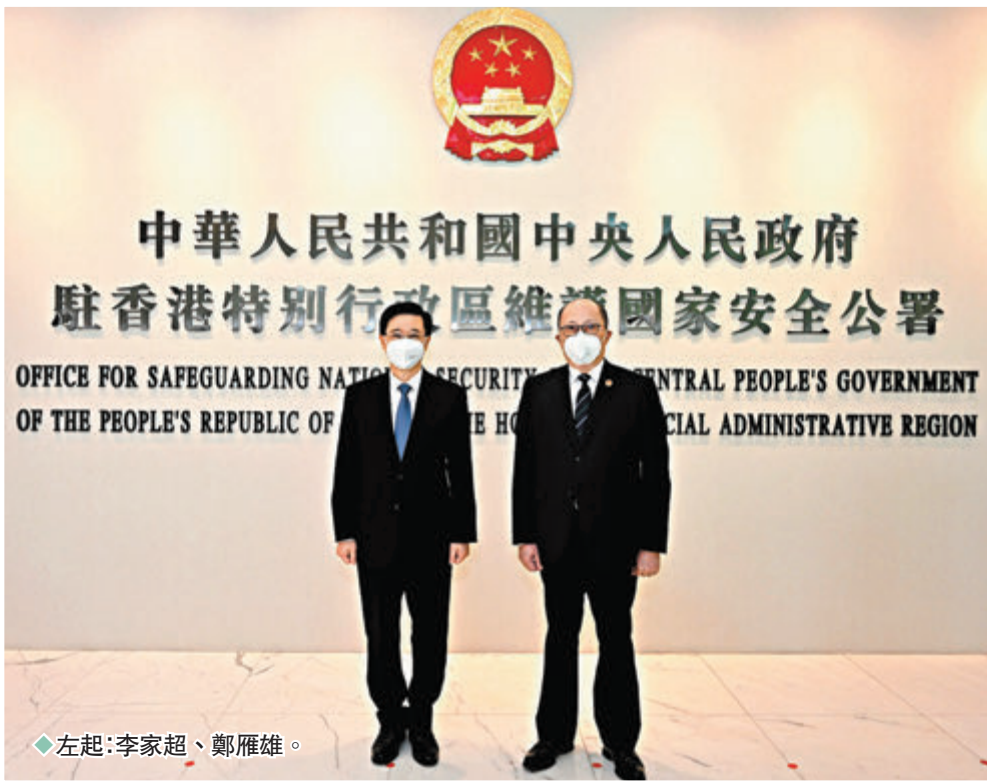
左起：李家超、鄭雁雄。

香港文匯報訊 李家超昨日下午到中央人民政府駐香港特別行政區維護國家安全公署拜會署長鄭雁雄。他感謝公署支持香港特區維護國家安全的工作，並表示新一屆特區政府會重視奠定發展的安穩基石。