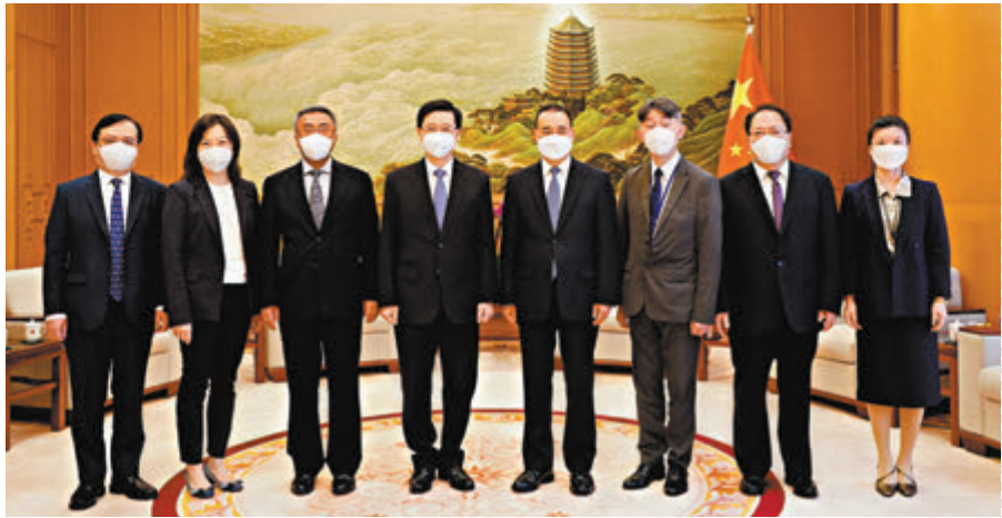
李家超（左四）拜訪外交公署，特派員劉光源（右四）對李家超高票當選表示熱烈祝賀。

香港文匯報訊 香港特別行政區第六任行政長官人選李家超5月9日下午拜訪外交部駐港公署，劉光源特派員對李家超高票當選表示熱烈祝賀。