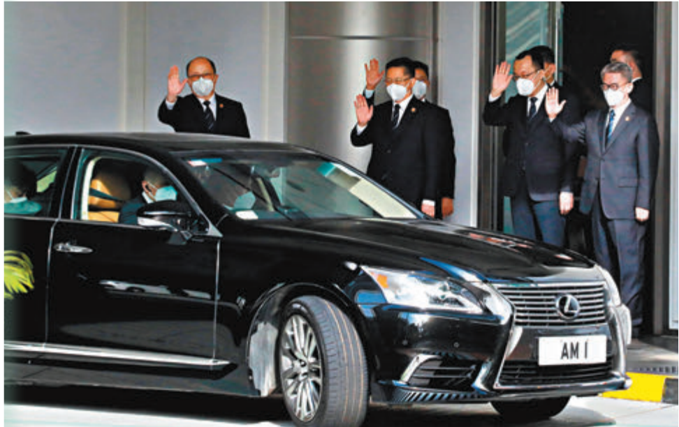
鄭雁雄等人向李家超揮手道別。