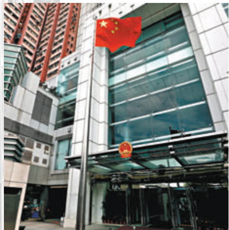
香港中聯辦大樓。