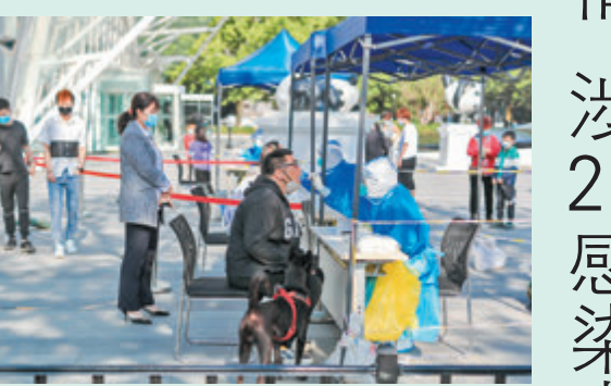
◆在北京市朝陽區一處核酸檢測點，民眾接受核酸篩查。