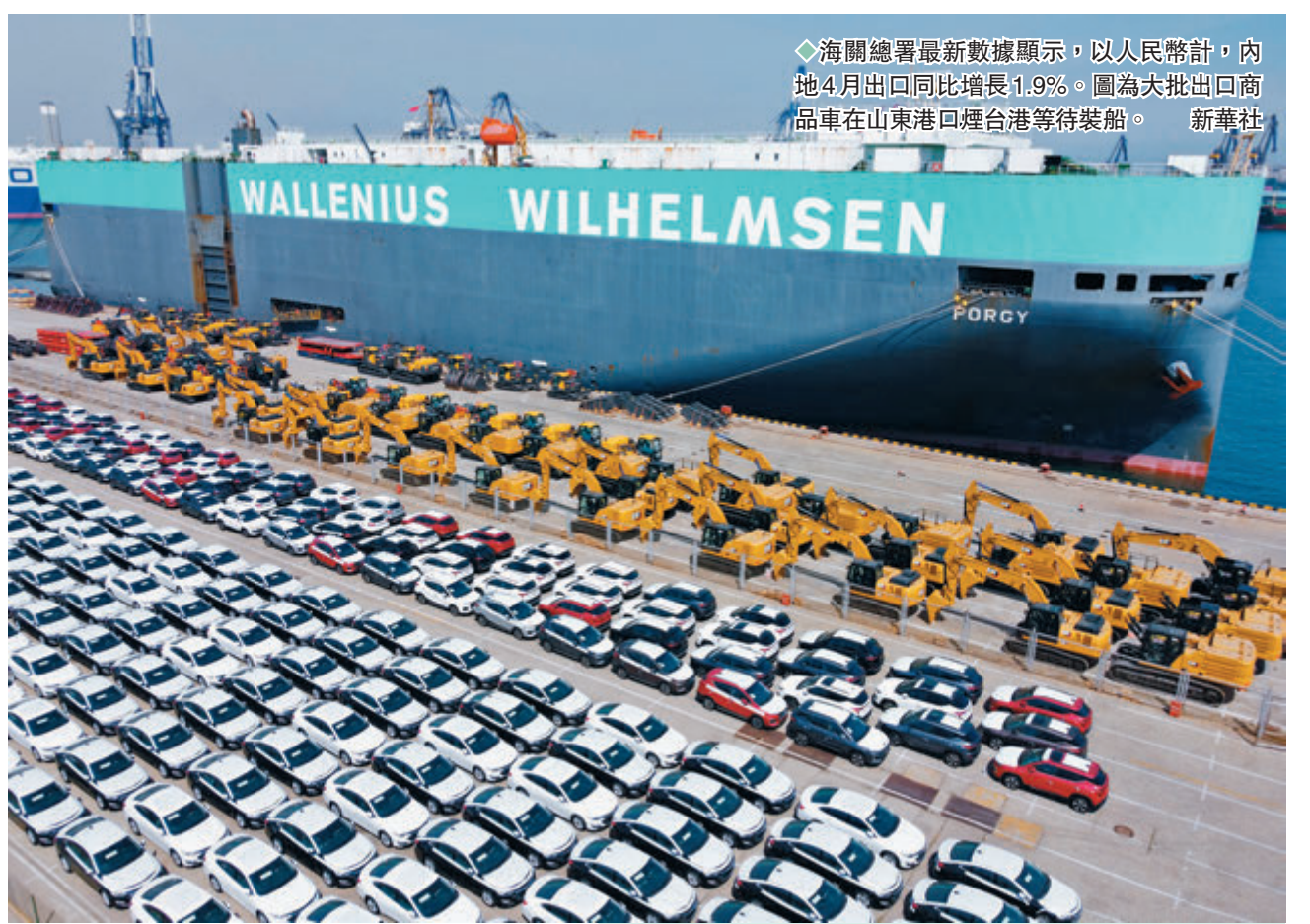
◆海關總署最新數據顯示，以人民幣計，內地4月出口同比增長1.9%。圖為大批出口商品車在山東港口煙台港等待裝船。

今年1-4個月，中國進出口總值12.58萬億元人民幣，同比增長7.9%。其中，出口6.97萬億元，增長10.3%；進口5.61萬億元，增長5%。海關總署數據還顯示，以美元計，4月出口同比增長3.9%，增速低於3月10.8個百分點；進口由3月的同比下降0.1%轉為同比持平；當月實現貿易順差511.2億美元，較3月增加37.4億美元。