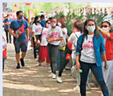
不少在港菲僑希望新政府關注海外僑工。