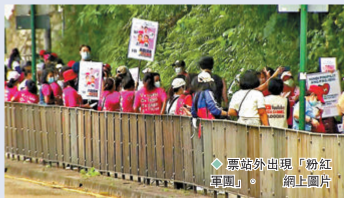
票站外出現「粉紅軍團」。

今屆菲律賓大選，在本港設有海外票站，菲律賓駐港總領館表示，上月10日起至昨日中午有超過5.8萬名菲律賓僑民投票，為歷屆最多。不少在港菲人到位於堅尼地城的香港拜仁里恒信託協會票站外為心儀候選人拉票，他們身穿不同顏色的衣服，代表所支持的候選人；粉紅色代表支持羅布雷多，白色和紅色象徵支持小馬科斯，她們並拉起選舉海報、派傳單和喊口號。