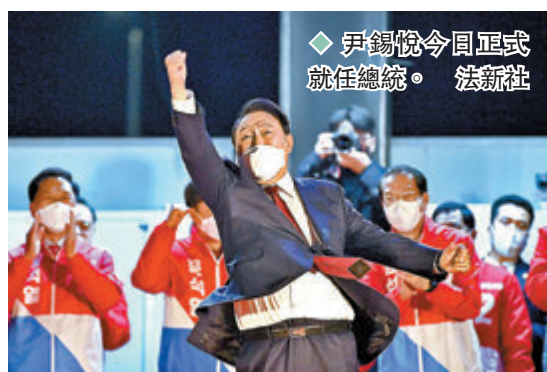
尹錫悅今日正式就任總統。

韓國候任總統尹錫悅今日正式就任總統，韓國民調機構Realmeter訪問逾2,000人，顯示51.4%受訪者對尹錫悅的施政前景表示樂觀，較上月底的調查上升1.7個百分點。即將卸任的韓國總統文在寅，昨日在青瓦台會見準備出席尹錫悅就職典禮的中國國家副主席王岐山，雙方就中韓關係發展方向交換意見。 尹錫悅今日早上會到國立首爾顯忠院參拜，隨後出席在國會大樓前舉行的總統就職典禮，並發表就職演講，之後會前往龍山國防部大樓內的總統辦公室，下午到國會出席慶祝儀式，晚上前往新羅酒店迎賓館出席外賓招待晚宴，正式結束就職日程。