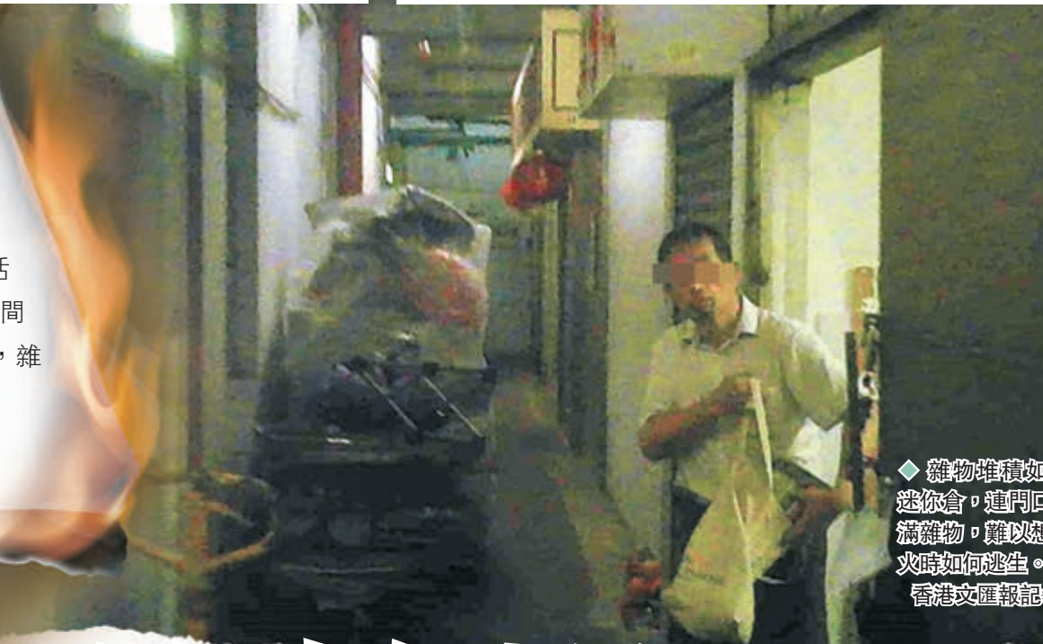
◆雜物堆積如山的迷你倉，連門口也堆滿雜物，難以想像失火時如何逃生。