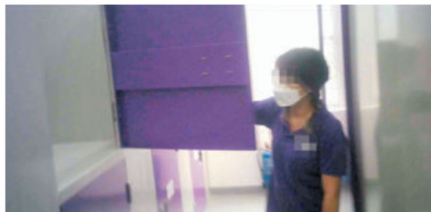
▲部分迷你倉通道淨闊度（不包括任何門的擺幅）疑不符合最少1.05米的規定。

消防處昨日回覆香港文匯報查詢時表示，該處聯同相關部門自2016年6月底開始，展開對全港迷你倉的巡查及執法工作，截至今年4月30日，消防處已巡查1,222間迷你倉，當中959間目標迷你倉共發現3,222項「常見火警危險」，並向其營運者發出「消除火警危險通知書」，規定獲送通知書的人在通知書指明的限期內消除火警危險。消防處亦已向221間未有遵從「通知書」的目標迷你倉營運者提出檢控。