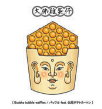
◆《大佛雞蛋仔》大佛人臉圖樣的造型紙盒，裝著圓潤美味的雞蛋仔。

此外，保羅先生特別為是次展覽全新創作了3幅以香港地道小吃為主題的作品——《大佛雞蛋仔》、《喜怒哀蛋撻》及《戲水鴛鴦咖啡》，進一步展現出保羅先生「文字具象化」的插畫功力。