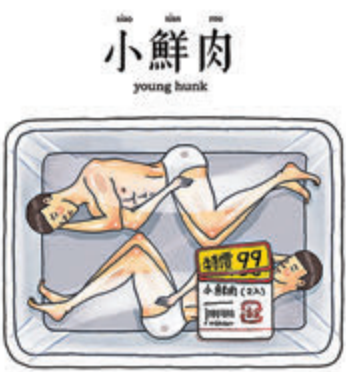
◆《小鮮肉》「小鮮肉，也有過期的時候。」

用文字諧音、繽紛飽滿的色調、鮮明的畫風，創作一系列引發共鳴又好笑的圖文作品，本港超人氣黑色幽默插畫家「保羅先生」（下稱保羅先生）由線上走到線下舉辦首個畫展，為初夏帶來一絲清涼。即日起至6月5日，「海港城·美術館」舉行保羅先生首個香港個人作品展「妙想天開」，精選他過去8年近50幅精彩作品，讓大家透過其幽默又獵奇的畫風、似曾相識的畫面而會心微笑。