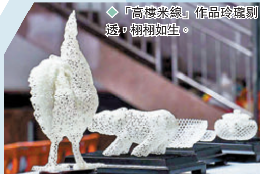
◆「高樓米線」作品玲瓏剔透，栩栩如生。