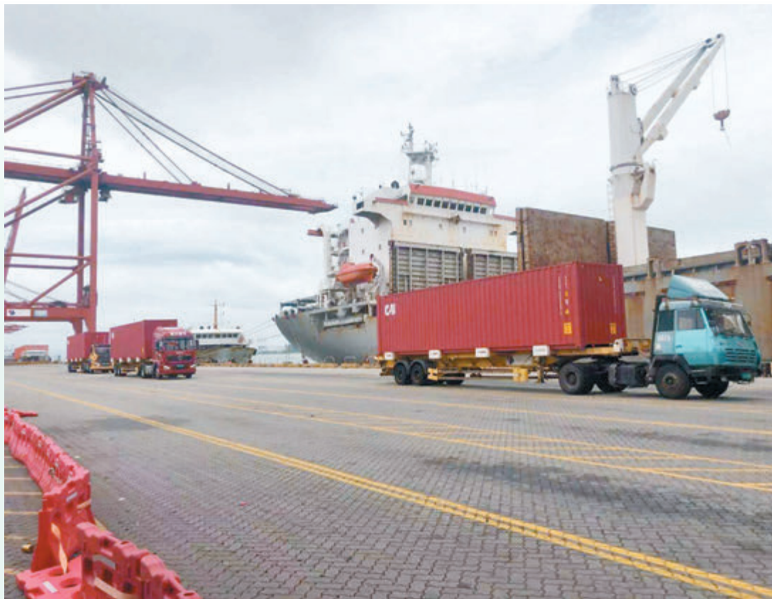
◆4月深港跨境駁船運輸出現增長。圖為大鵬灣駁船在裝貨。