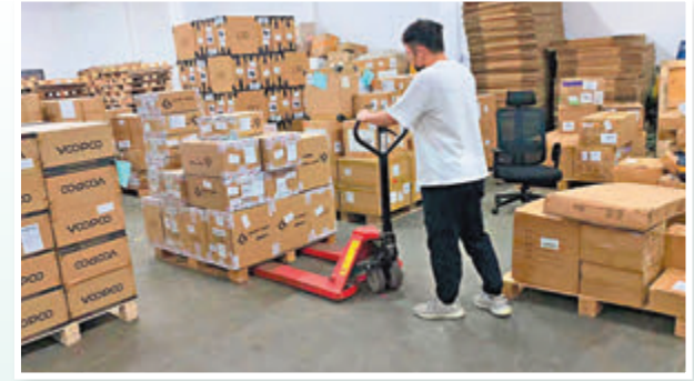
◀圖為深圳一貨代公司向香港機場發貨。