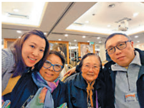
◆再見阿姨（右二）！

同一天我再送別舊友，應該是舊同事，這幾十年共事過多間機構，合作關係愉快，也有不少往事回憶，年紀不大卻不幸患癌離世！已很少去送別這些場合，亦決定送她一程！但願她樂觀積極的人生態度影響身邊每一個人！