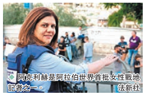
阿克利赫是阿拉伯世界首批女性戰地記者之一。

以軍表示，軍方昨日進入傑寧附近的難民營逮捕「犯罪嫌疑人」。嫌疑人向以軍開火並投擲爆炸物，以軍才予以還擊。軍方表示