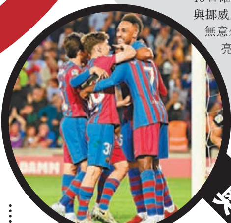
◆奧巴美揚(紅藍衫,右)是役梅開二度。

英國媒體稱，曼城為得到夏蘭特，激活了他與德甲多蒙特合同中6,000萬歐元的解約條款。夏蘭特有望與曼城簽約5年，周薪和曼城前鋒奇雲迪布尼比肩，大約為40萬鎊。夏蘭特9日已經在比利時通過了曼城的體檢。 據說西甲豪門皇家馬德里和巴塞隆納都曾與夏蘭特有過接觸，但這位當紅新星最終選擇了父親曾經效力的球隊，追隨父親球員時代的步伐征戰英超賽場。