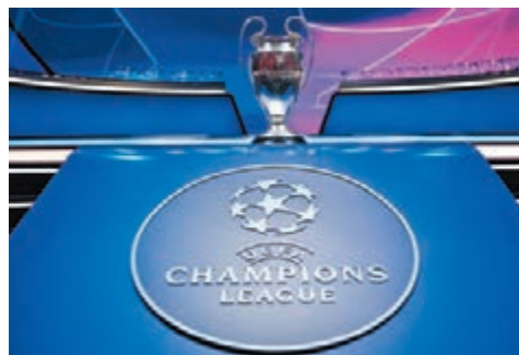
▲歐聯賽制進行大幅度的改革。 法新社 ▶國際足協主席恩芬天奴(左)與歐洲足協主席施費連，在大會上握手致意。 法新社

至於4個新增參賽名額的方案具體為：1個名額分給在歐洲賽積分榜排名第五的聯賽；1個名額分給附加賽，通過附加賽晉級正賽的由4隊增至5隊，給小國聯賽球隊更多的參賽機會；另外2個名額則分給於前一屆歐洲賽表現最好的兩個聯賽，積分計法以該屆歐洲賽總積分除以本國聯賽參賽球隊數目，例如本賽季結束時根據聯賽集團表現，各增1個參賽名額的將是英格蘭和荷蘭聯賽。 第二級別的歐霸盃及第三級別的歐洲協會聯賽亦會根據上述方式改革。歐洲足球協會主席施費連在奧地利維也納召開的大會上表示，賽制改革方案已採納各持份者的意見，並獲得了廣泛同意，相信新賽制有助改善競技層面的平衡，並產生可觀的收入，這可用作回饋給歐洲球會和平民足球的發展。