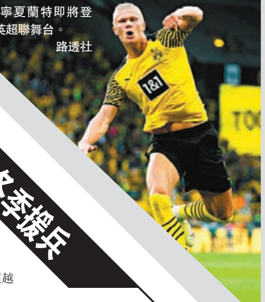
◆艾寧夏蘭特即將登陸英超賽場。

香港文匯報訊(記者郭正謙) 西甲豪門巴塞隆納由名宿沙維維賽季中途接手執教，鞭後成績漸趨穩定，射手奧巴美揚更在其麾下煥發第二春，於本港時間昨日凌晨在切爾達身上梅開二度，協助球隊主場以3:1輕鬆取勝。奧巴美揚自冬季加盟後已取11個聯賽入球，成為13年來西甲最高效的冬季收購。 步入「後美斯時代」的巴塞在沙維維麾下漸漸重返正軌，雖然今季沒有冠軍進帳，不過加維及柏迪等新星出現讓球隊看到了未來希望。在冬季轉會窗加盟的奧巴美揚亦重拾射手本色，連同今場對切爾達的兩球，15場聯賽入了11球，成為西甲史上第3位入球達11球的冬季新援，聯賽尚餘兩場下更有望打破施積所創下的13球紀錄。 狀態回勇的奧斯文尼比利亦交出兩記助攻，今季共錄得13次助攻，超越賓施馬暫登本賽季西甲助攻榜頭名。