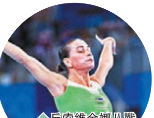
◆丘索維金娜八戰奧運會後曾短暫引退。

綜合新華社報道 47歲烏茲別克體操傳奇名將丘索維金娜日前表示，她已下定決心備戰巴黎奧運會。此前她曾表示，希望在職業生涯結束前，能在杭州亞運會上為烏茲別克奪得一面獎牌。亞奧理事會本月6日宣布杭州亞運會延期舉辦。而根據烏茲別克奧委會最新消息，丘索維金娜已決定在亞運會後再繼續備戰巴黎奧運會，屆時她將年滿49歲。從1992年以獨聯體選手身份參賽到代表烏茲別克出戰，再因為兒子治病改為德國籍，最終又恢復烏茲別克國籍的丘索維金娜八戰奧運會的故事堪稱傳奇。她去年東京奧運會後曾短暫「退役」，在重回賽場後今年三場國際體操世界盃分站賽上則奪得兩金一銀。