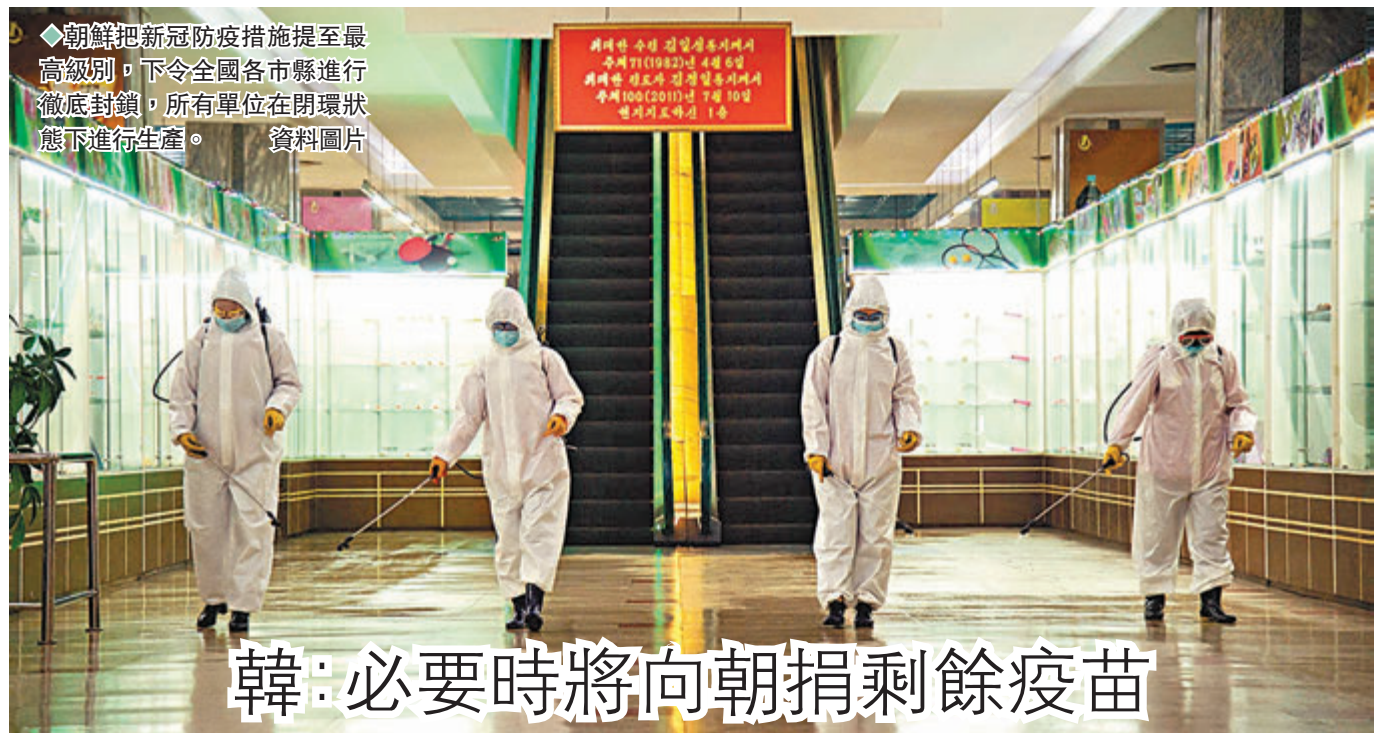
◆朝鮮把新冠防疫措施提至最高級別，下令全國各市縣進行徹底封鎖，所有單位在閉環狀態下進行生產。 資料圖片