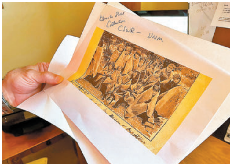
◆首批調查的408間學校中，單是其中19間學校便記錄逾500名兒童死亡。