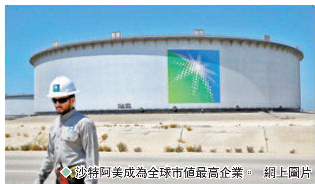
◆沙特阿美成為全球市值最高企業。網上圖片