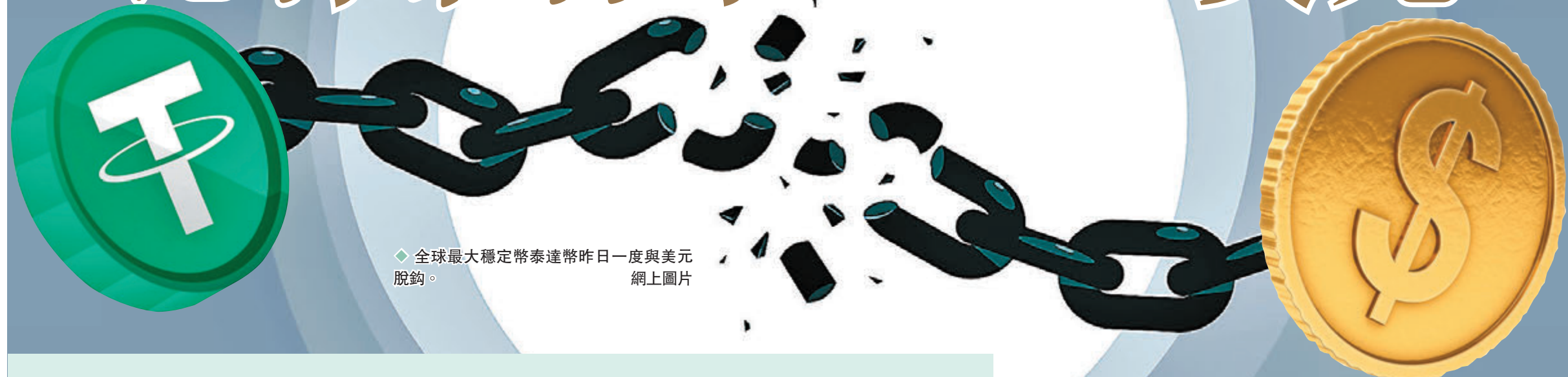
◆全球最大穩定幣泰達幣昨日一度與美元脫鈎。網上圖片

加密貨幣市場近日哀鴻遍野，先是比特幣受經濟前景拖累連跌7日，之後多隻號稱「穩定」的穩定幣 (stablecoin) 亦出現插水式下跌，繼 TerraUSD (UST) 及支撐 UST 的虛幣 LUNA 與美元脫鈎再暴瀉後，全球最大穩定幣泰達幣 (USDT) 昨日亦一度與美元脫鈎，低見 0.9511 美元。發行 USDT 的 Tether 揚言會不惜成本維持掛鈎，包括出售所持美債資產。消息拖累比特幣昨日最多跌 10%，低見 25,402 美元，再創 2020 年 12 月以來新低。