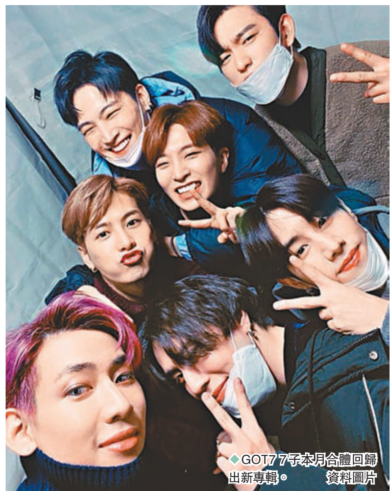
◆GOT7 7年本月合體回歸出新專輯。