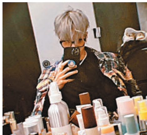
◆王嘉爾的工作浪接浪,昨在社交平台晒出準備上妝自拍照。