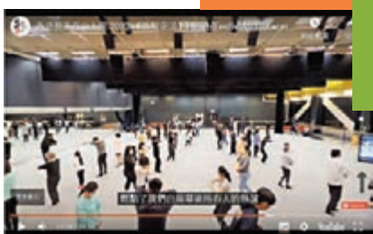
◆《活現童話》展現作品創作故事。

「我一直希望與不同年齡段的人合作。」Gilmore說，「我享受他們之間的那種活力，那種趣味和能量。還有小孩子身上的放肆與野性，對成年人來說是有正面影響的，因為我們成年人似乎失去了玩