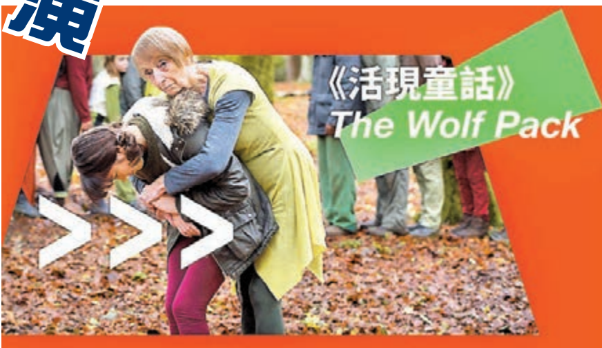
《活現童話》 The Wolf Pack

香港藝術節@大館2022線上版採用了不同形式呈現演出。例如《我呢一代口琴人》用了輕鬆網劇的方式，讓不同年代的表演者們遙距互動，各自使出渾身解數表演之餘，亦配上珍貴照片和錄像，向觀眾講述口琴的故事。舞蹈劇場《吟嘆調》放映舞作的採排片段之餘，還對編舞黎海寧進行了訪問，進一步展現作品背後的理念。至於視聽演出《千花瓣》，則將數碼影像與樂演奏相結合，呈現充滿薩滿儀式感的音樂旅程。每個作品的網上版都帶來不同風格與體驗。