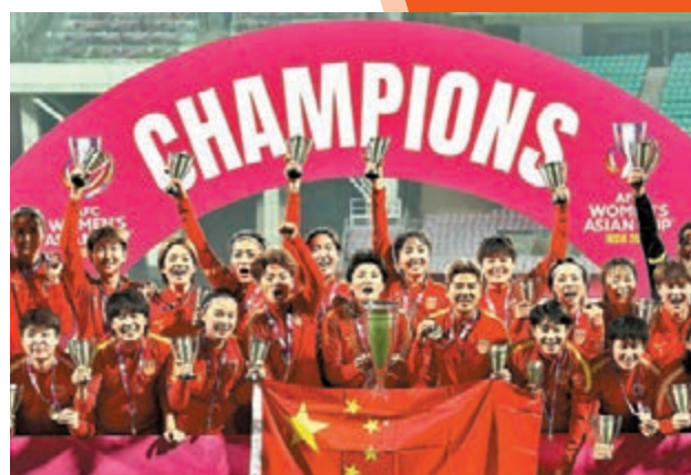
中國女足以亞洲盃冠軍的身份躋身世界盃決賽周。 資料圖片

香港文匯報訊（記者 陳曉莉）世界桌球巡迴賽（WST）香港時間昨日宣布兩項重要決定，第一，桌球世界錦標賽從2023年起將恢復所有輪次19局10勝的賽制，第二，提升新賽季若干項賽事的獎金，包括英格蘭、蘇格蘭、威爾士、北愛爾蘭4站本土系列賽+歐洲大師賽+德國大師賽+土耳其大師賽+英國公開賽，其中4站本土賽冠軍獎金從7萬英鎊提升到8萬英鎊，其他4站比賽冠軍獎金不變，但其他輪次的獎金都有相對應的提升。