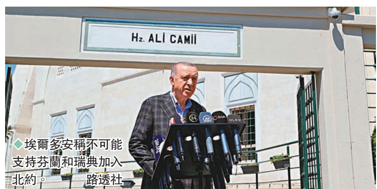
◆埃爾多安稱不可能支持芬蘭和瑞典加入北約。路透社