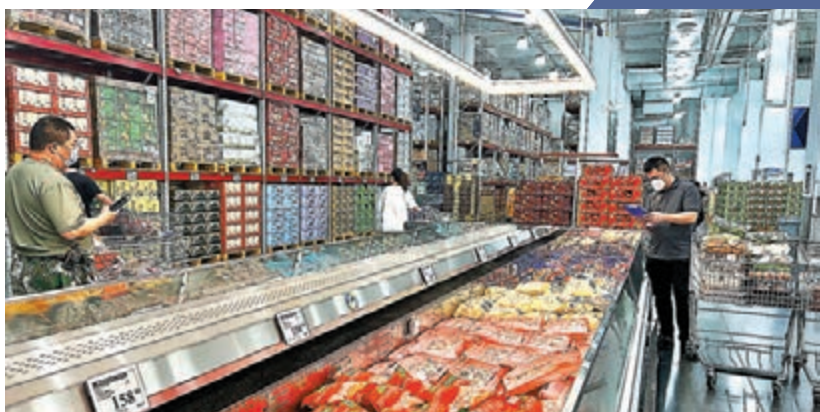
◆上海目前「防疫三區」區分情況

香港文匯報訊(記者 倪夢環 上海報導)上海進一步推進復商復市，線下商舖期待再迎客來。在15日舉行的上海市政府新聞發布會上，上海市副市長陳通表示，16日起，上海將分階段推進復商復市，包括購物中心、超市賣場等商業網點將逐步有序恢復線下營業。香港文匯報記者從多個商家了解到，不少門店已做好準備，積極應待復工。目前，上海一些防範區商超已開門迎客，市民可進行預約入店，截至14日，上海防範區已達50,558個，涉及人口數1,864萬。