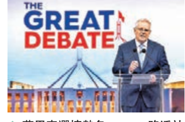
◆莫里森選情勢危。路透社