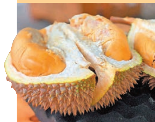
◆貓山王種植成本上升。

馬來西亞農業和食品工業部副部長阿末韓查前日表示，受雨季持續影響，當地今年榴槤產量預料會大幅下降，加上各類種植成本上升，黑刺和貓山王榴槤的售價可能上升一倍。阿末韓查指，今年3月底至4月的雨季影響了榴槤的授粉和開花，某些州份的榴槤產量大減五成。加上肥料和勞動成本增加，預期今年榴槤價格將上升一倍，當中黑刺榴槤預計升至每公斤超過100令吉(約178港元)，貓山王則從每公斤30至40令吉(約54至71港元)，升至60至80令吉(約107至143港元)。他又說，甘榜榴槤的價格也可能上升。阿末韓查表示榴槤價格完全取決於生產和供應，當局暫時沒有計劃採取控制措施。 ◆綜合報道