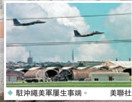
◆駐沖繩美軍屢生事端。